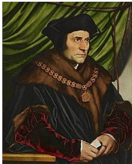
Томас Мор 1478-1535 английский юрист

Утопия (с греч. «благое место») — представления, описывающие модель идеального общества. В отличие от антиутопии характеризуется верой автора в безупречность модели.