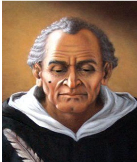
Томмазо Кампанелла 1568 – 1639 итал. философ