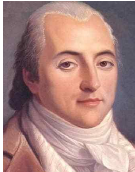
Анри Сен-Симон 1760-1825 фр. философ