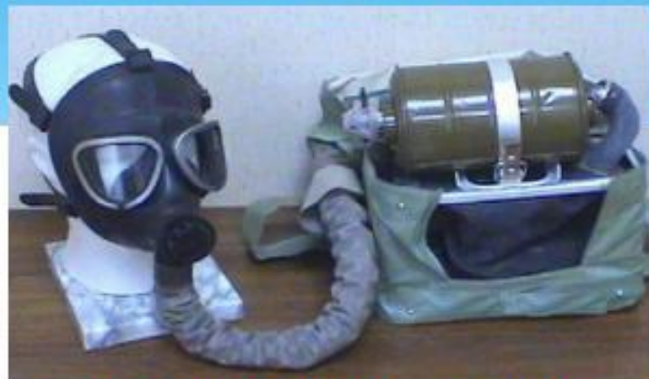
Изолирующий прот. (ИП-4М)