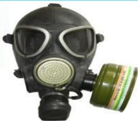
Гражданский пр-з УЗС ВК