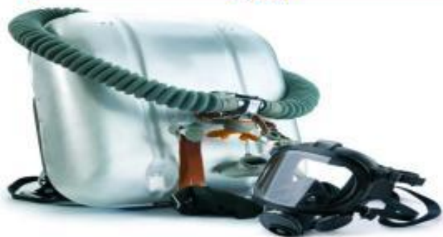
Изолирующий респиратор (Р-34)