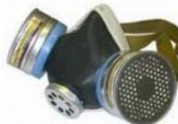
ый респиратор РУ