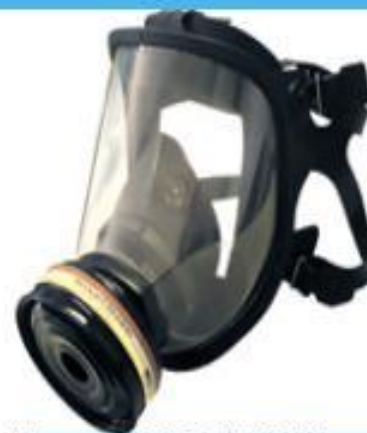
Промыш. противогаз ФФМГ-96