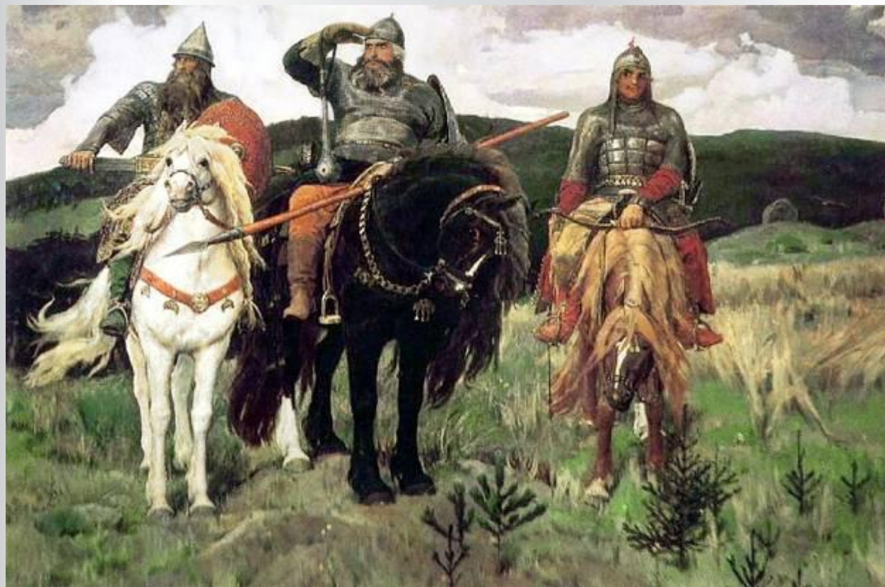
В. Васнецов. «Богатыри»