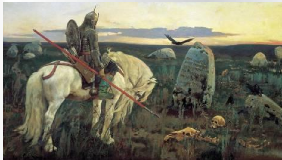
В.Васнецов. «Витязь на распутье»

Прямо ехать- убиту быть; направо ехать- женату быть; а налево ехать- богатому быть.