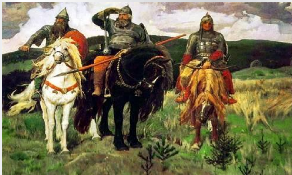
В. Васнецов «Богатыри»