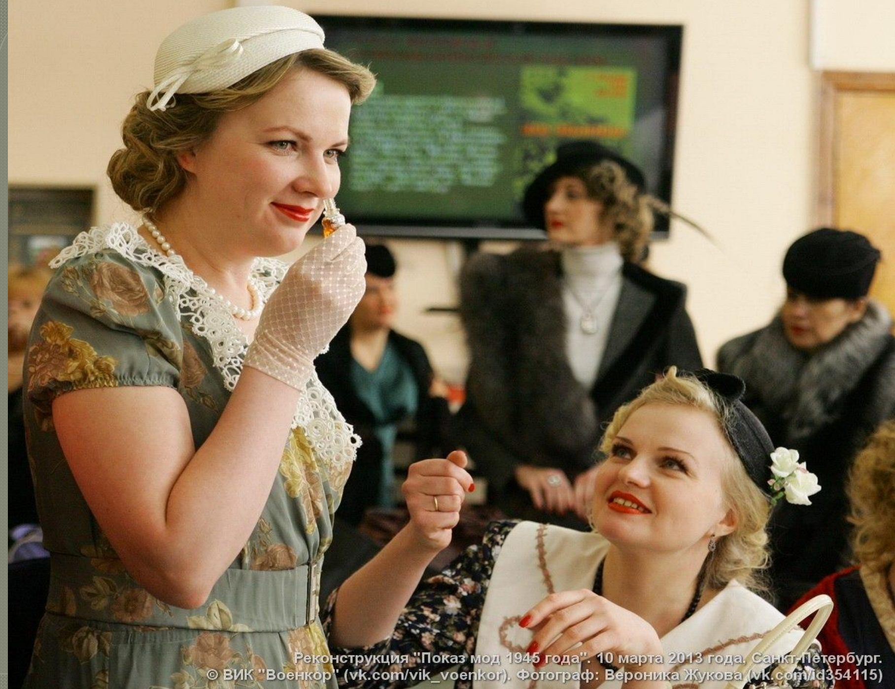
Реконструкция "Показ мод 1945 года". 10 марта 2013 года, Санкт-Петербург.