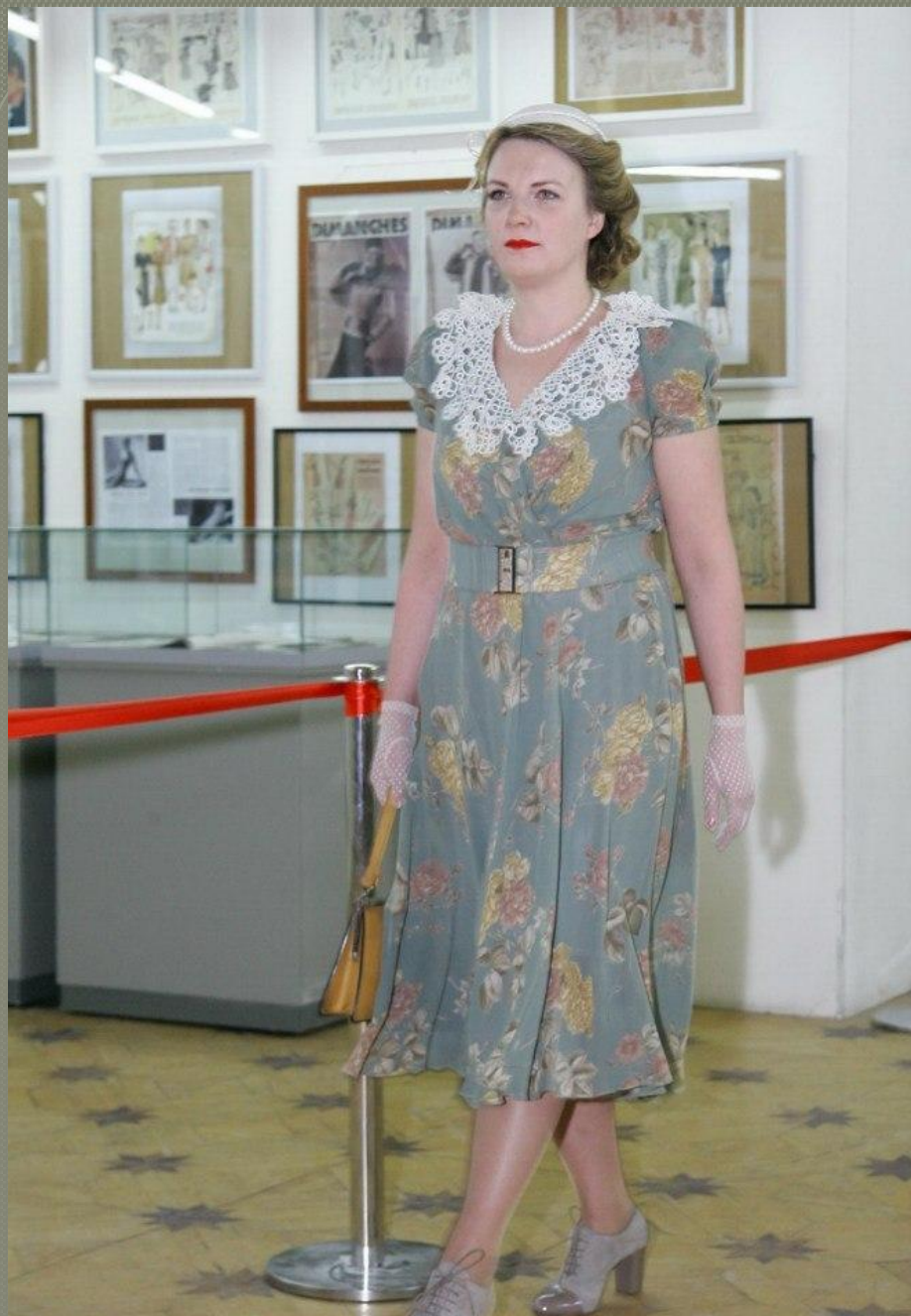
Реконструкция "Показ мод 1945 года". 10 марта 2013 года. Санкт-Петербург.