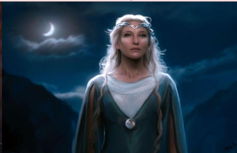
Ельфійська королева леді Галадріель