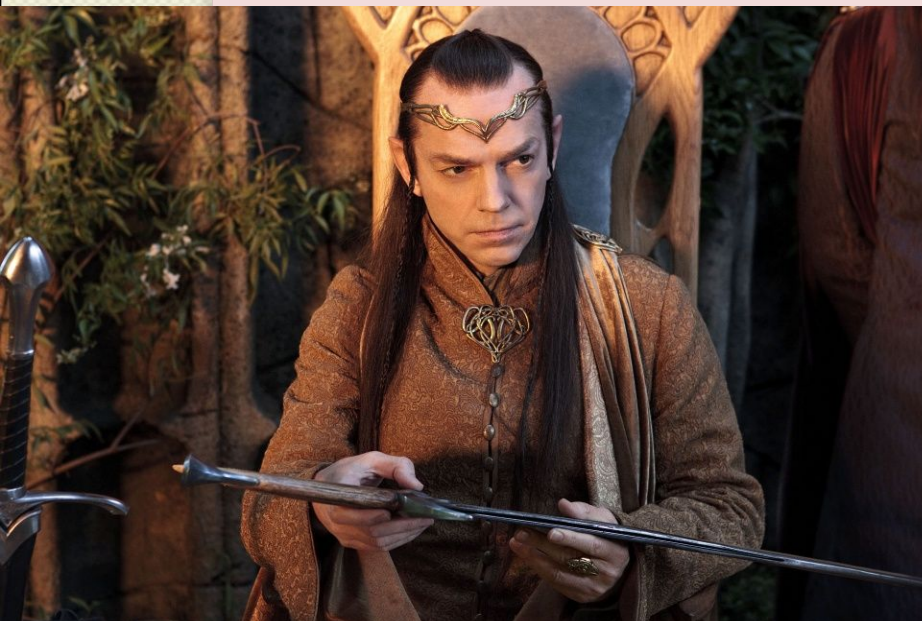
Лорд Елронд, напівельф