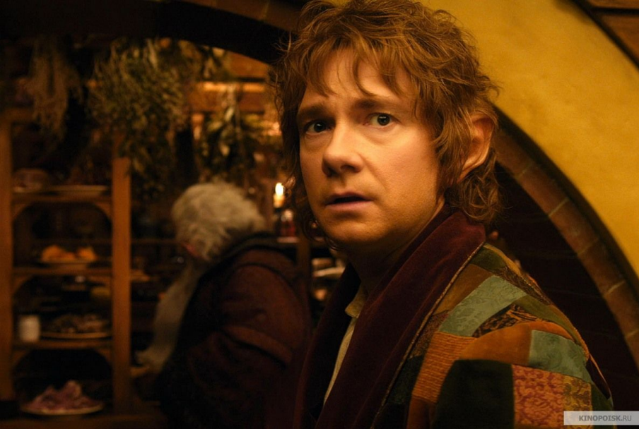
Гобітт, Більбо Бегінс