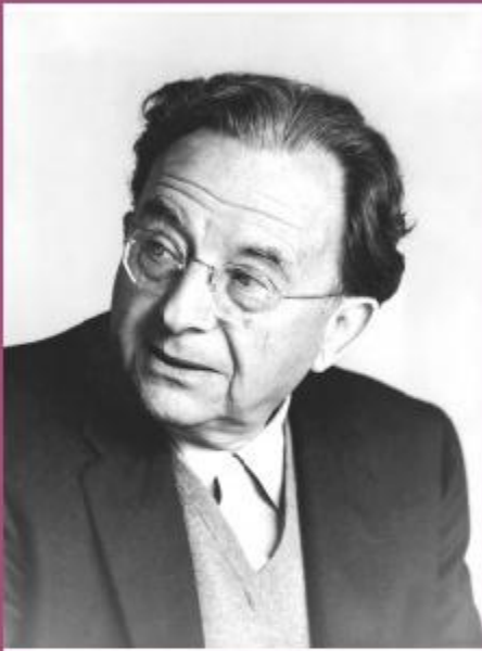
Еріх Фромм (1900- 1980)