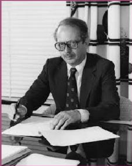
Ральф Дарендорф (1929- 2009)