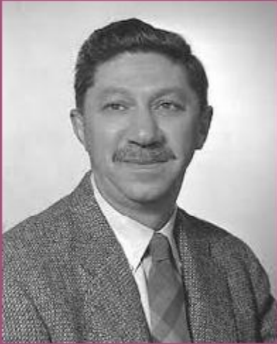
Абрахам Маслоу (1908-1970)