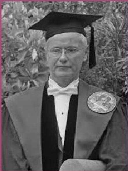
Роберт Мертон (1910-2003), теорія структурного функціоналізму

“СТАТУСНИЙ НАБІР” - сукупність усіх соціальних статусів людини, що характеризують її становище в суспільстві