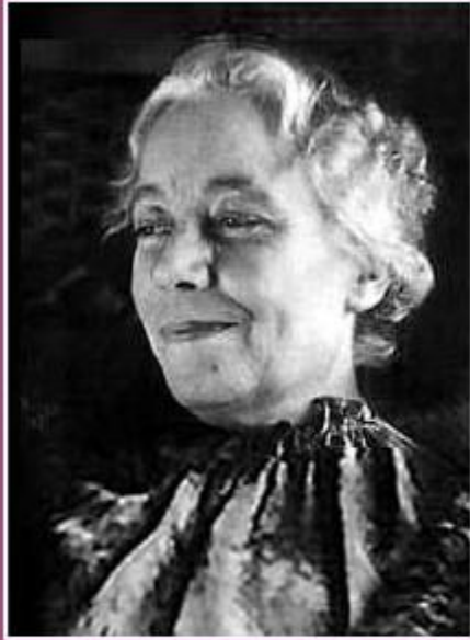
Карен Хорні (1885-1952)

Критерій типологізації особистостей - характер взаємодії з іншими.