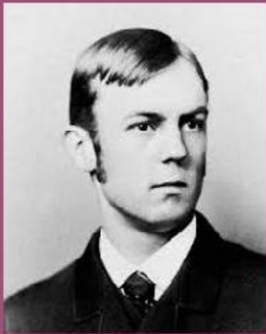
Чарльз Кулі (1864-1929), теорія “дзеркального “Я”