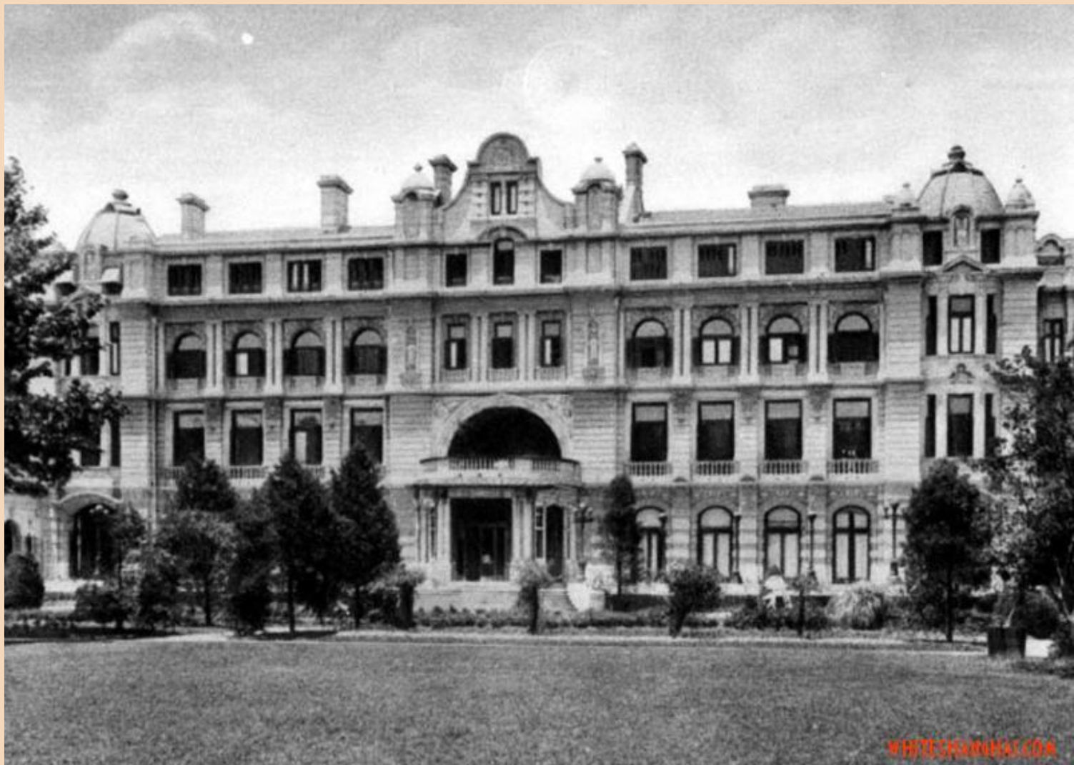
Московская консерватория имени П.И. Чайковского