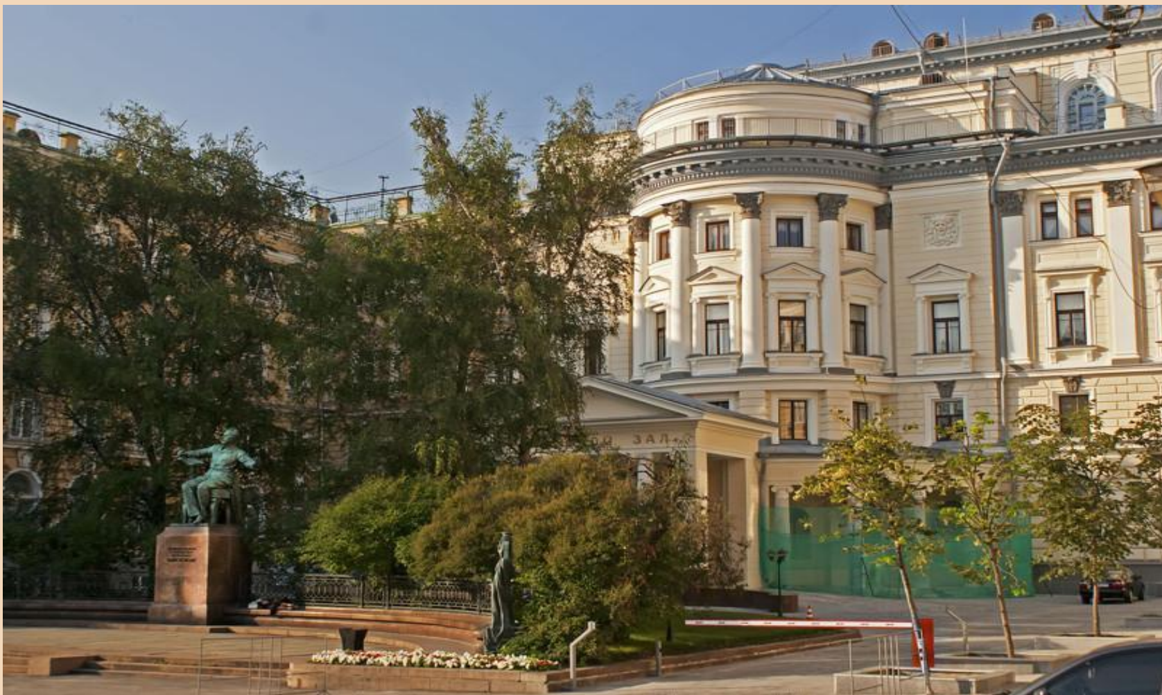
Московская государственная консерватория имени П. И. Чайковского