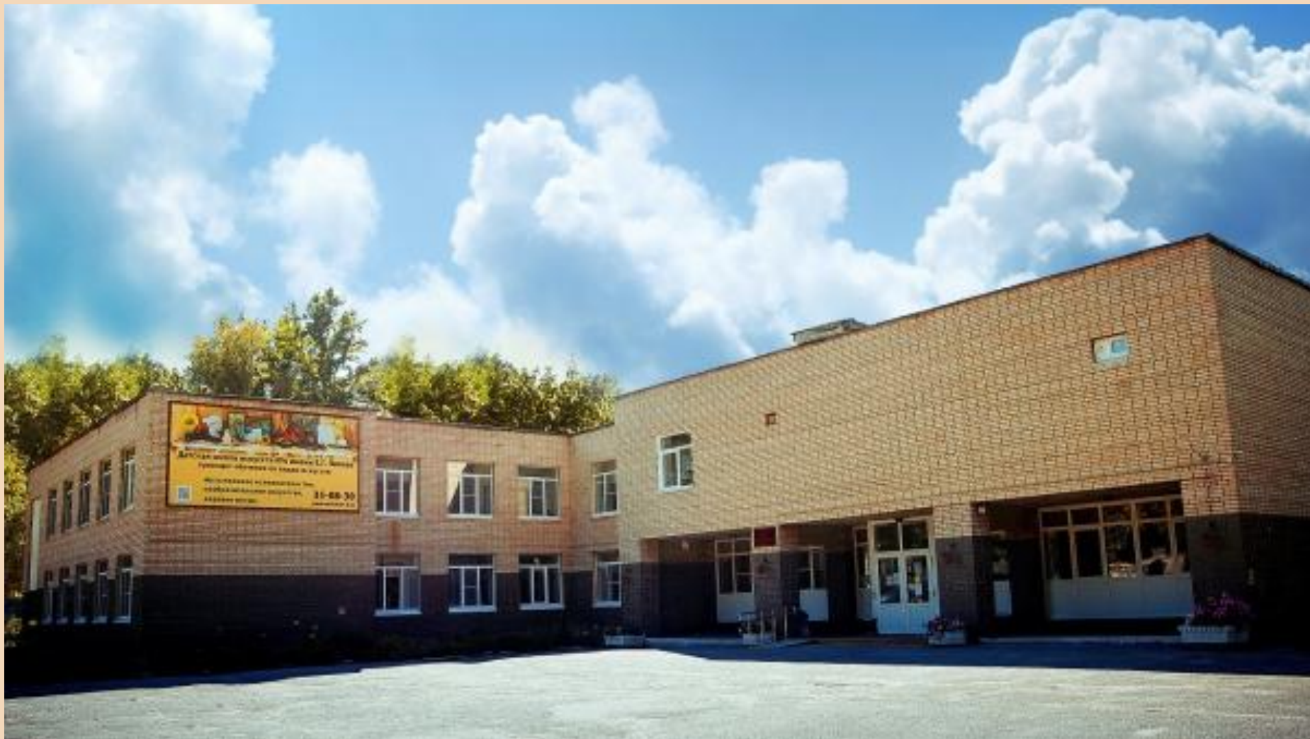
Школа искусств № 4 г. Рязань