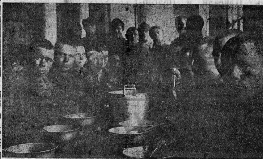
Красноармейцы В.-Удинского гарнизона за обедом.

24 июня в № железнодорожном полку (парк за рекой Удой)