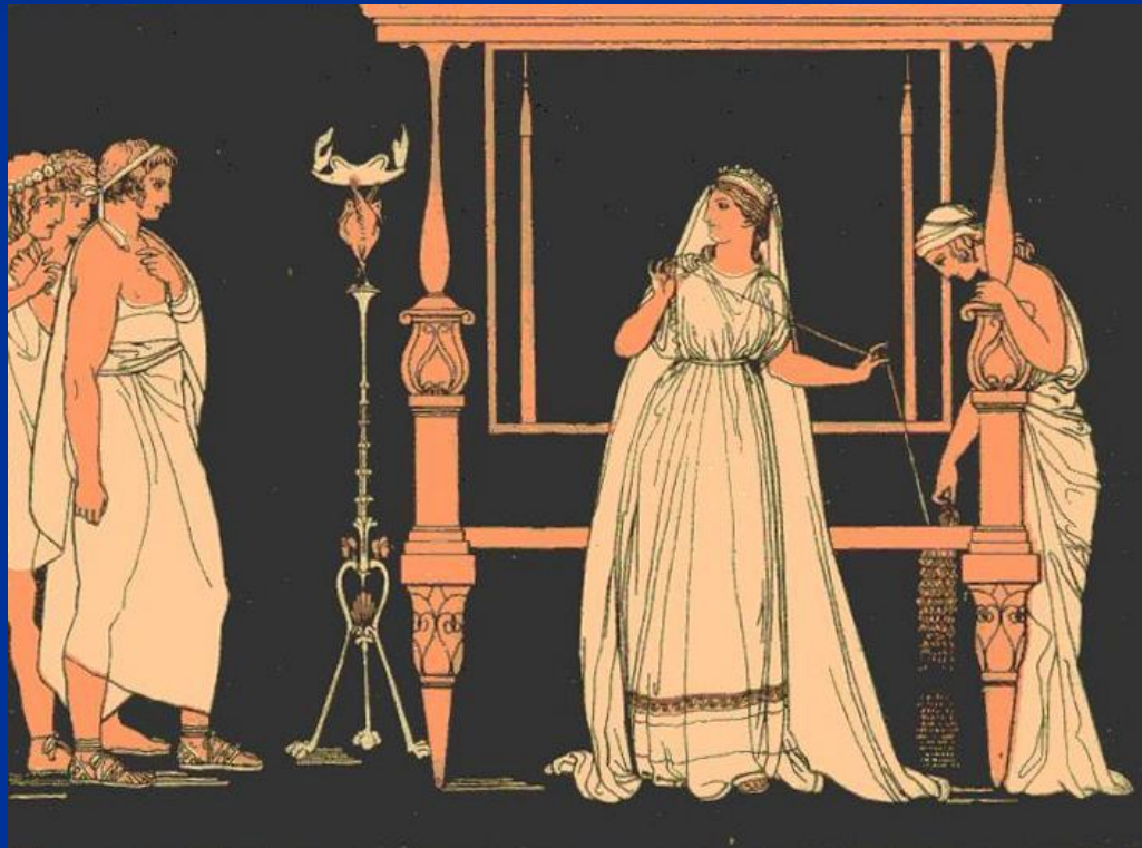
Дж. Флакман. Пенелопа и женихи

«Одиссея» – поэма Гомера о 10-летнем странствии Одиссея после Троянской войны