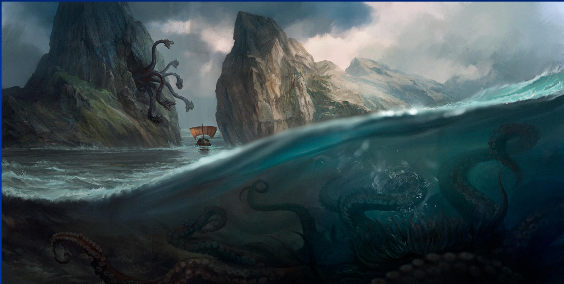
Сцилла и Харибда. Рисунок

Сцилла и Харибда – морские чудовища, уничтожавшие корабли в узком проливе