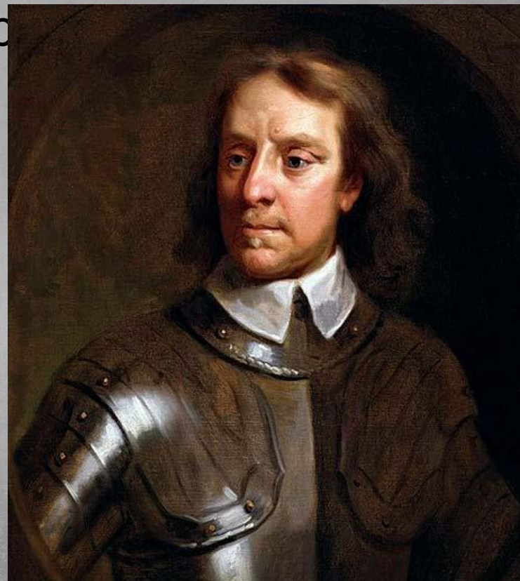
Оливер Кромвель (лидер)