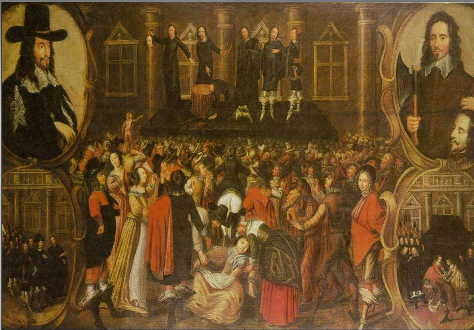
Казнь Карла 1