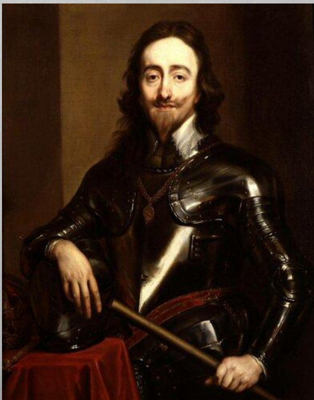
Карл I Стюарт