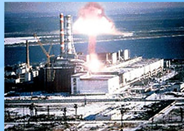
Авария на Чернобыльской АЭС, весна 1986 г.