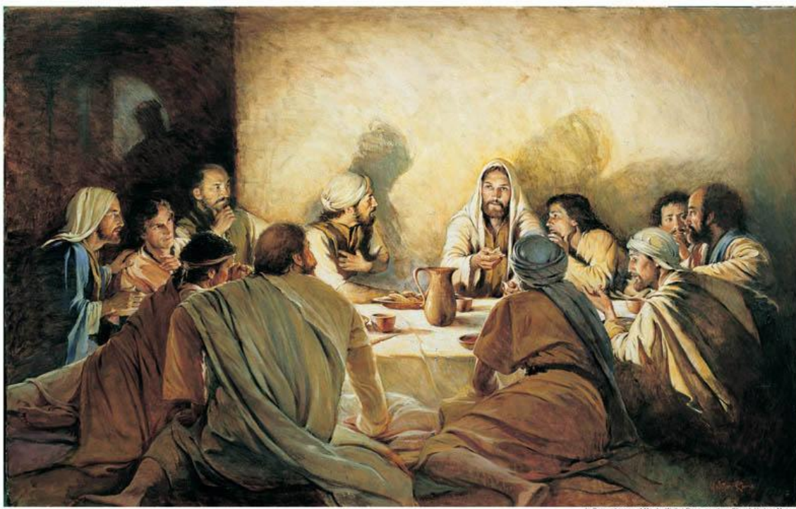
In Remembrance of Me, by Walter Crane

Один законник встал и, искушая Иисуса, сказал: