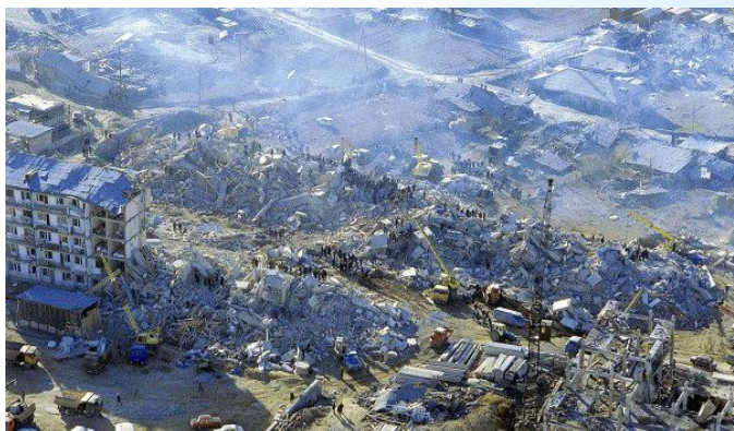
Землетрясение в Армении (г.Спитак), зима 1988 г.