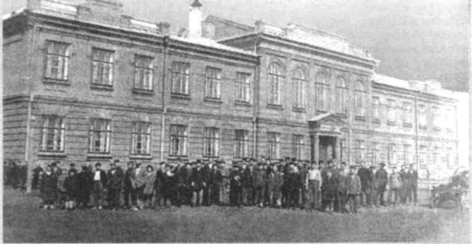
Спаста Алиш укыган мәктәп (педтехникум) бинасы. 20 нче еллар фотасы.