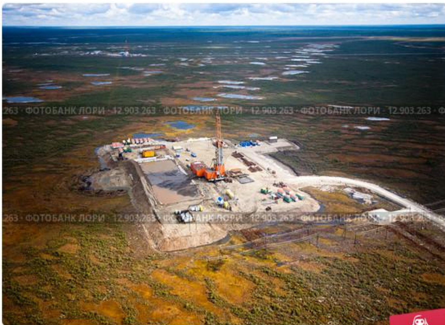
Буровая вышка в Сибири, среди болота, вид сверху