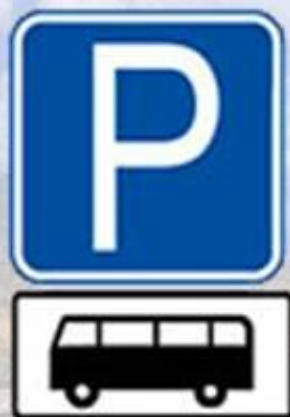
«Вид транспортного средства»

Знаки дополнительной информации (таблички). Эти знаки отличаются от всех других дорожных знаков. Они имеют небольшие размеры, прямоугольную форму и, как правило, чёрные надписи и изображения на белом фоне. Особенность этих знаков заключается в том, что они используются только вместе с другими дорожными знаками.