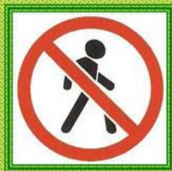
Движение пешеходов запрещено