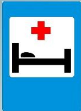
Пункт первой медицинской помощи

Информируют о расположении соответствующих объектов.