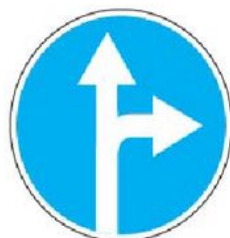
4.1.4 Движение прямо или направо