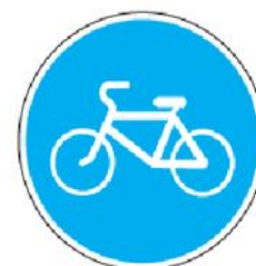
4.4.1 Велосипедная дорожка или полоса