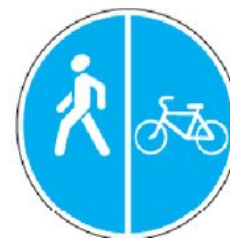
4.5.5 Пешеходная и велосипедная дорожка