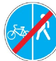
4.5.6 Конец пешеходной и велосипедной дорожки с разделением движения