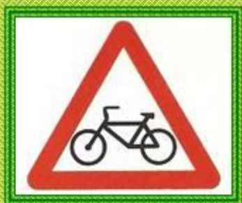
Пересечение с велосипедной дорожкой

Треугольные знаки с красным ободком — предупреждающие.