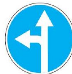
4.1.5 Движение прямо или налево