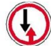
2.6 Преимущество встречного движения