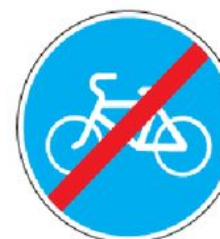
4.4.2 Конец велосипедной дорожки или полосы