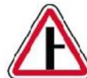
2.3.2 Примыкание второстепенной дороги