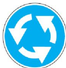
4.3 Круговое движение