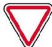
2.4 Уступите дорогу