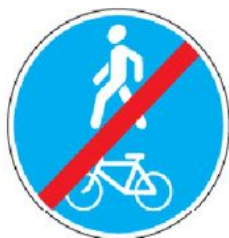
4.5.3 Конец пешеходной и велосипедной дорожки