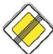
2.2 Конец главной дороги