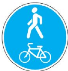
4.5.2 Пешеходная и велосипедная дорожка