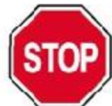
2.5 Движение без остановки запрещено