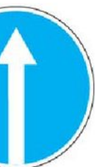
4.1.1 Движение прямо