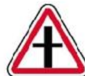
2.3.1 Пересечение с второстепенной дорогой