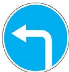
4.1.3 Движение налево