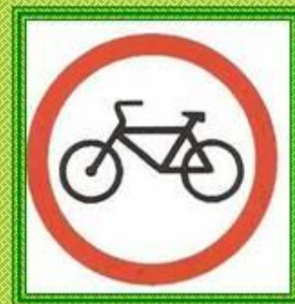
Движение на велосипедах запрещено