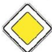
2.1 Главная дорога