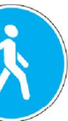
4.5.1 Пешеходная дорожка