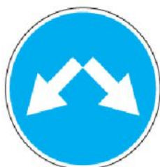
4.2.3 Движение направо или налево