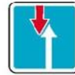
2.7 Преимущество перед встречным движением