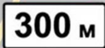
«Расстояние до объекта»