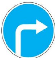
4.1.2 Движение направо