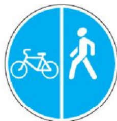
4.5.4 Пешеходная и велосипедная дорожка с разделением движения