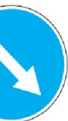
4.2.1 Объезд препятствия справа