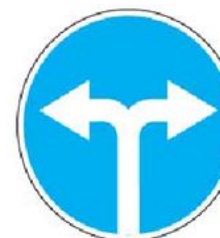
4.1.6 Движение направо или налево