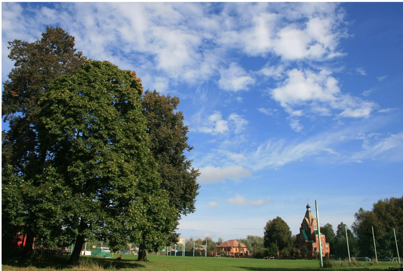
МУРАШОВА ЮЛИЯ АЛЕКСАНДРОВНА, 2002 г.р. Номинация: «Наша общая планета» «А Я ЛЮБЛЮ СВОИ МЕСТА РОДНЫЕ»