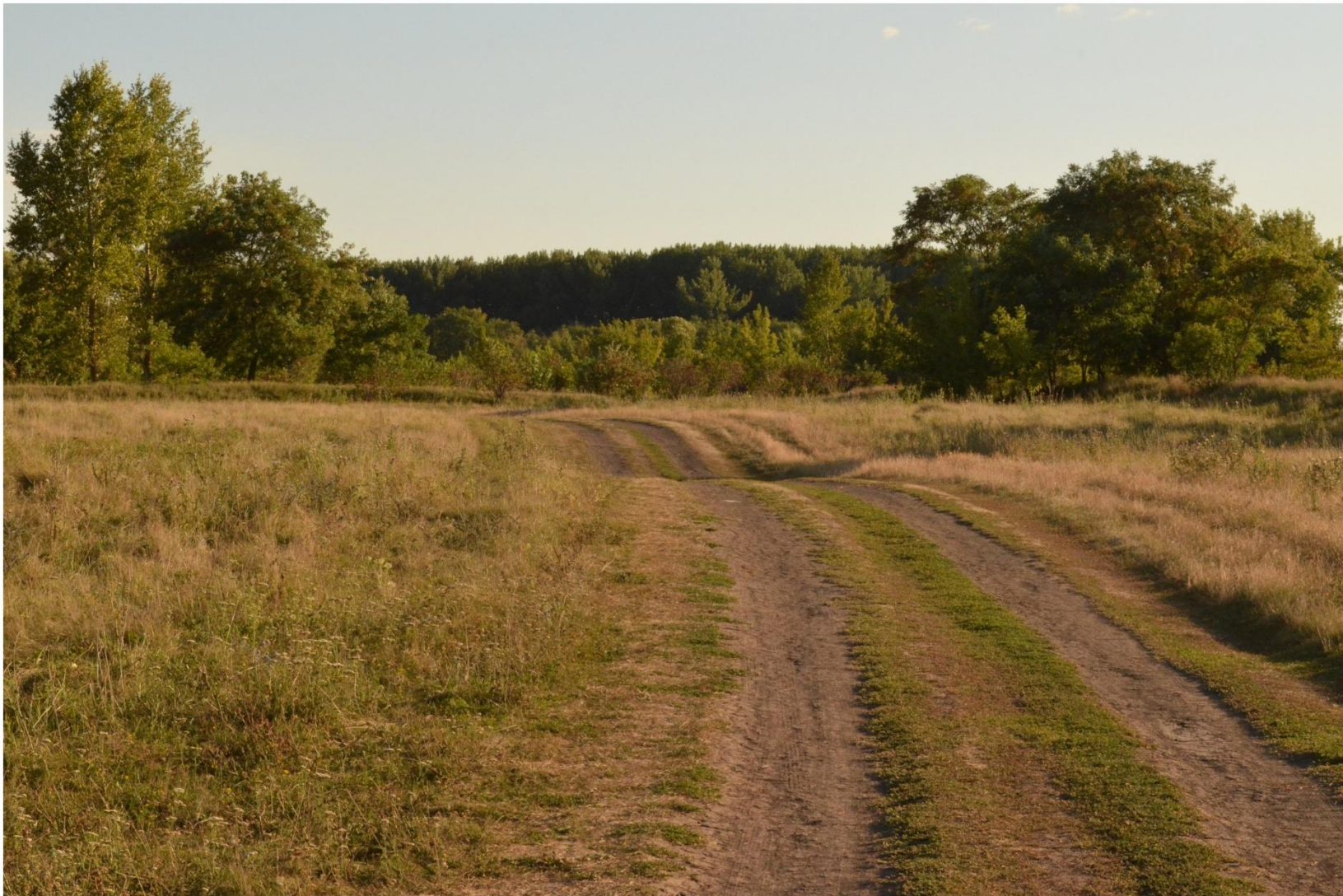
КОЛОДЯЖНАЯ ДАРЬЯ АЛЕКСАНДРОВНА, 1999 г.р. Номинация: «Наша общая планета» «ДОРОГА, ДОРОГА, ТЫ ЗНАЕШЬ ТАК МНОГО...»