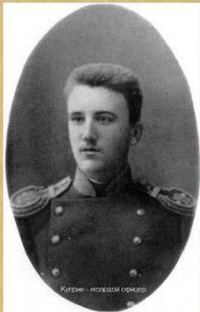
Кутрин - молодой офицер

В 1880 году он сдал вступительные экзамены во Вторую московскую военную гимназию, которая два года спустя была преобразована в кадетский корпус. И снова форма: "Чёрная суконная курточка, без пояса, с синими погонами, восемью медными пуговицами в один ряд и красными петлицами на воротнике". Тягостная жизнь «казенного мальчика» изображена им в повести «На перевале» (Кадет