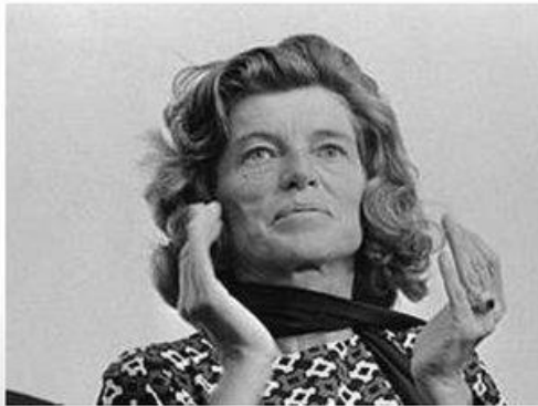
Основатель Международной организации Специальных олимпиад Юнис Кеннеди- Шрайвер

Девиз Специальной Олимпиады: «Позвольте мне победить. Но, если я не смогу, пусть я буду смелым в этой попытке!».