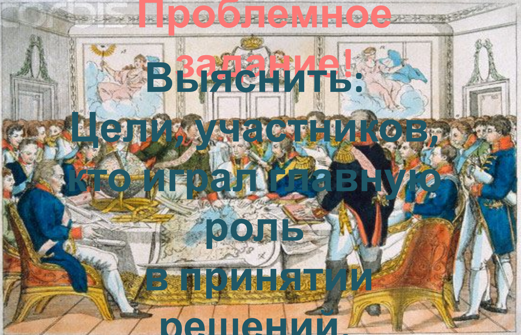
Der große Wiener Friedens-Congress zur Wiederherstellung von Freiheit und Recht in Europa. 1. Kaiser Franz 2. ... 3. ... 4. ... 5. ... 6. ... 7. ... 8. ... 9. ... 10. ...