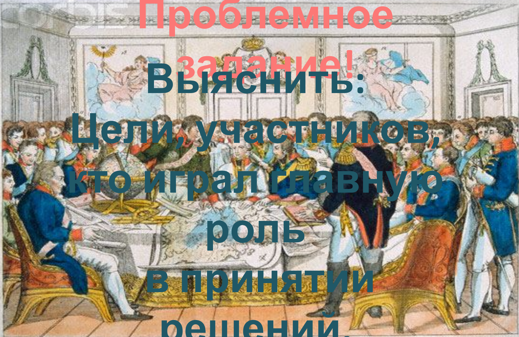
Der große Wiener Friedens-Congress zur Wiederherstellung von Freiheit und Recht in Europa. 1. Kaiser & Frau 2. ... 3. ... 4. ... 5. ... 6. ... 7. ... 8. ... 9. ... 10. ... 11. ... 12. ... 13. ... 14. ... 15. ... 16. ... 17. ... 18. ... 19. ... 20. ... 21. ... 22. ... 23. ... 24. ... 25. ... 26. ... 27. ... 28. ... 29. ... 30. ... 31. ... 32. ... 33. ... 34. ... 35. ... 36. ... 37. ... 38. ... 39. ... 40. ... 41. ... 42. ... 43. ... 44. ... 45. ... 46. ... 47. ... 48. ... 49. ... 50. ... 51. ... 52. ... 53. ... 54. ... 55. ... 56. ... 57. ... 58. ... 59. ... 60. ... 61. ... 62. ... 63. ... 64. ... 65. ... 66. ... 67. ... 68. ... 69. ... 70. ... 71. ... 72. ... 73. ... 74. ... 75. ... 76. ... 77. ... 78. ... 79. ... 80. ... 81. ... 82. ... 83. ... 84. ... 85. ... 86. ... 87. ... 88. ... 89. ... 90. ... 91. ... 92. ... 93. ... 94. ... 95. ... 96. ... 97. ... 98. ... 99. ... 100. ...