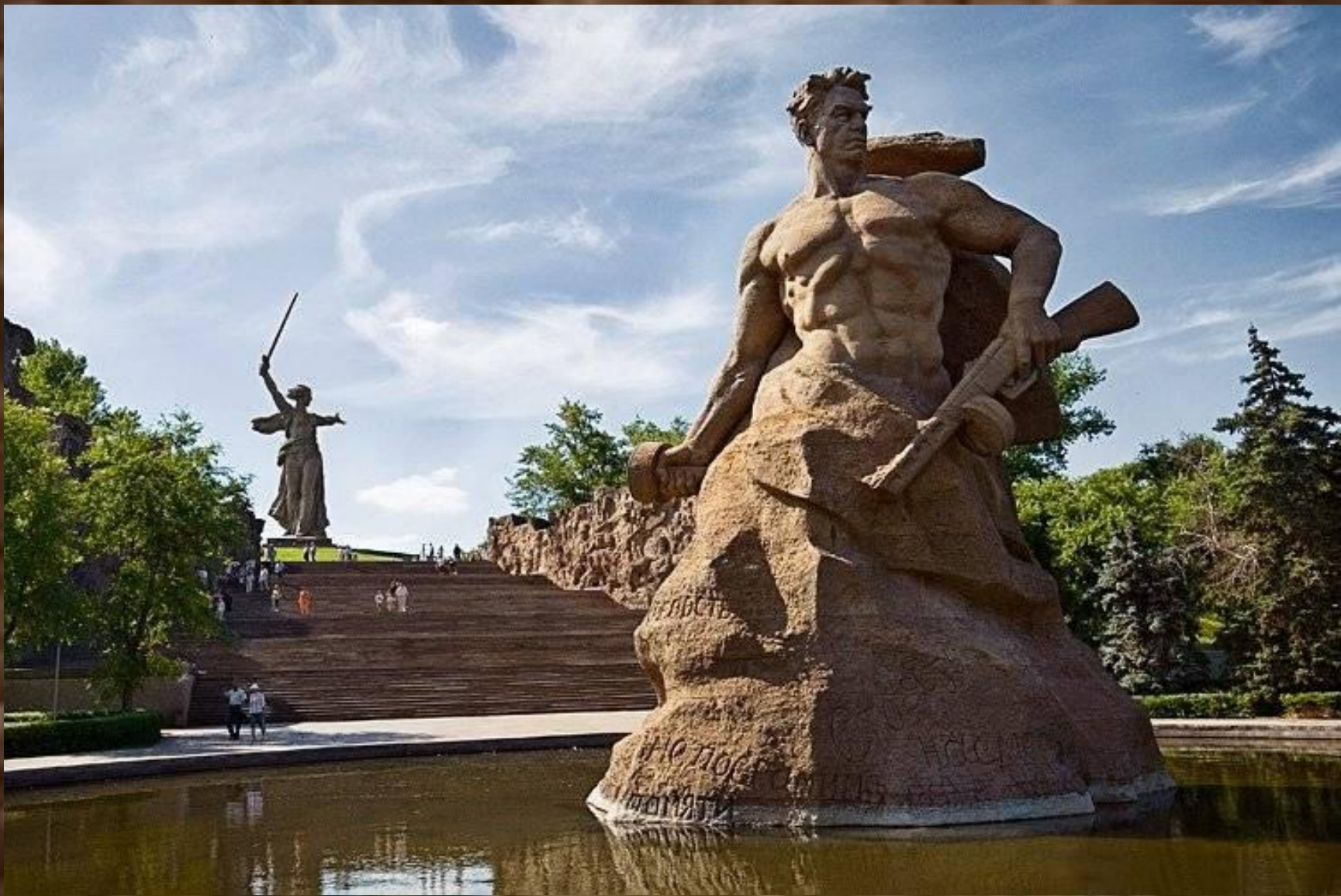
Памятник-ансамбль героям Сталинградской битвы. Скульптура «Стоять насмерть». 1967.