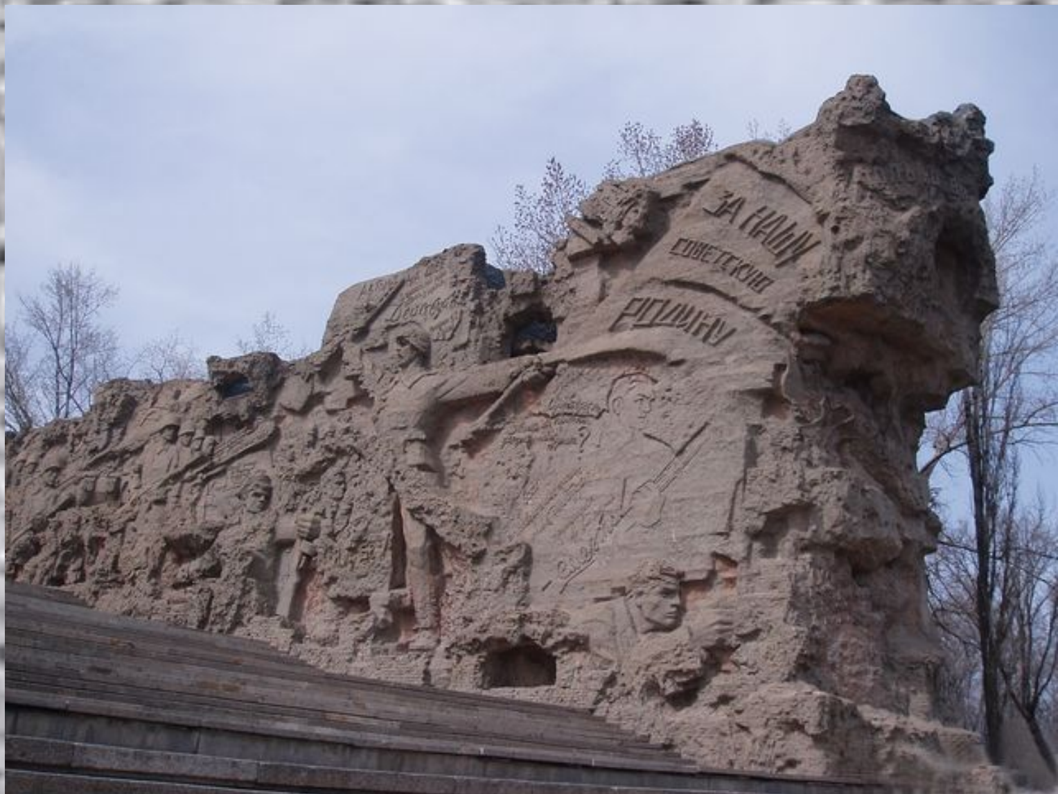
Памятник-ансамбль героям Сталинградской битвы. Фрагмент «Стены-руины». 1967.