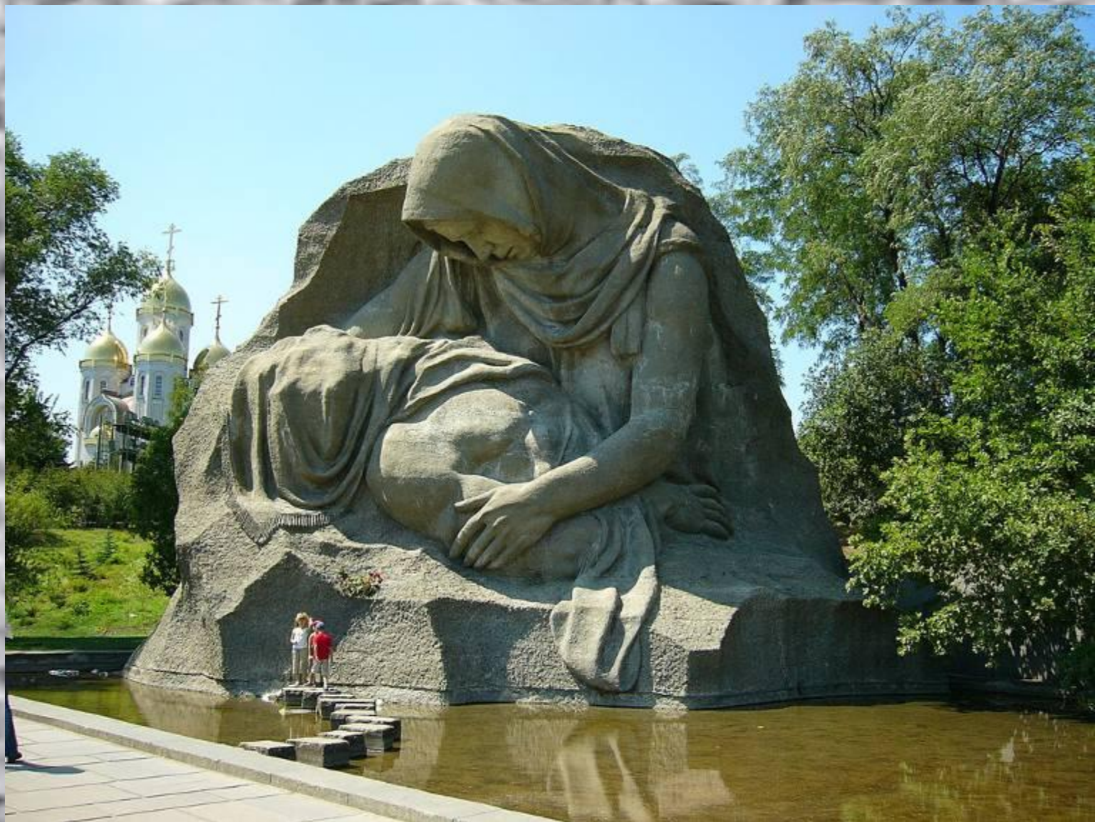
Памятник-ансамбль героям Сталинградской битвы. Скульптура «Скорбящая Мать». 1967.