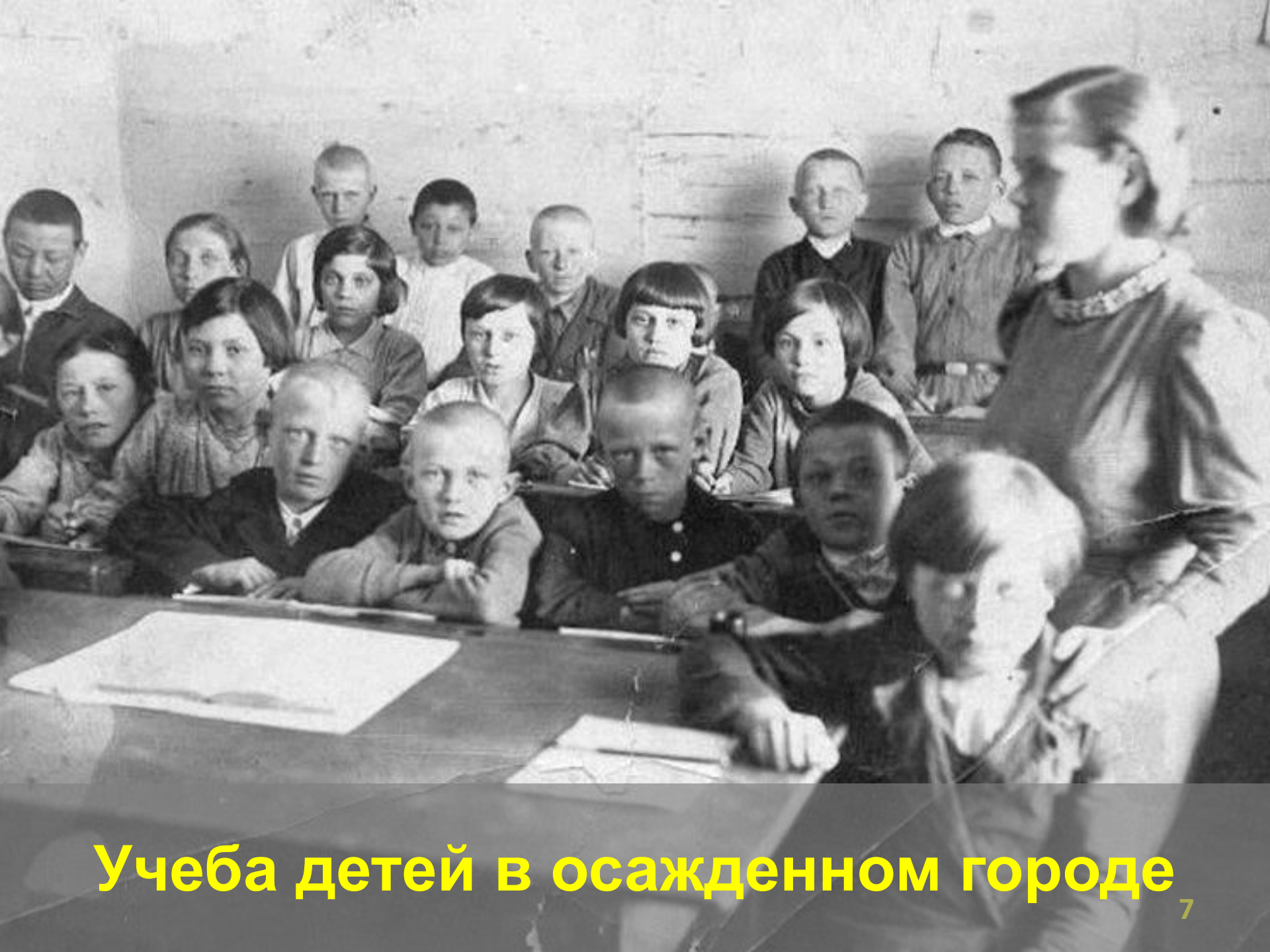
Учеба детей в осажденном городе