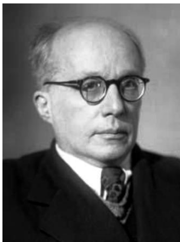
С.Л. Рубинштейн (1889-1960 гг.)