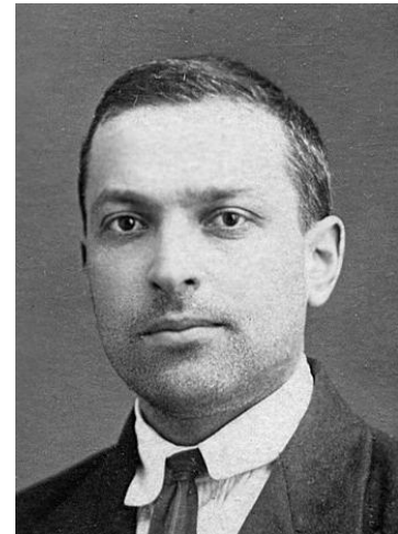
Л.С. Выготский (1896-1934 гг.)