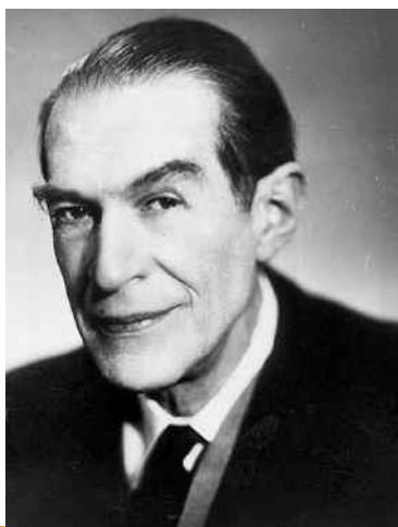
А.Н. Леонтьев (1903-1979 гг.)

«Психология – это наука о порождении, функционировании и структуре субъективного образа действительности в ходе осуществления предметной деятельности индивида».