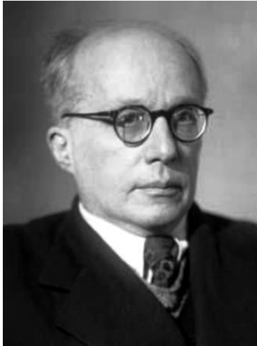
С.Л. Рубинштейн (1889-1960 гг.)