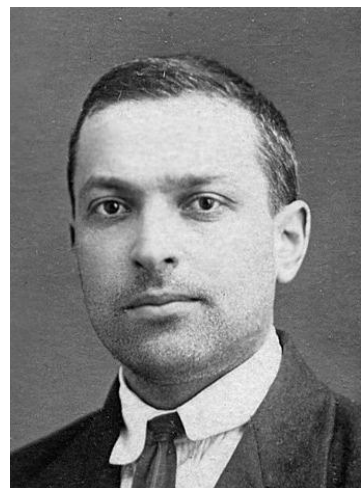
Л.С. Выготский (1896-1934 гг.)