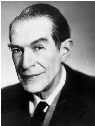
А.Н. Леонтьев (1903-1979 гг.)

«Психология – это наука о порождении, функционировании и структуре субъективного образа действительности в ходе осуществления предметной деятельности индивида».