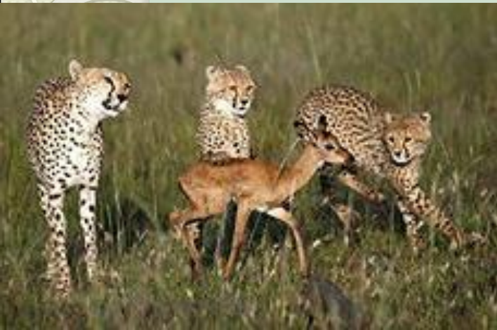
Учатся охотиться детёныши леопардов