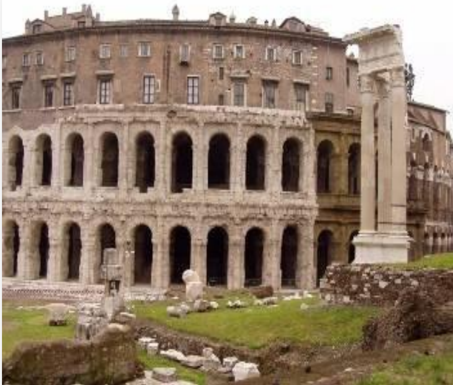
Marcellovo divadlo v Římě