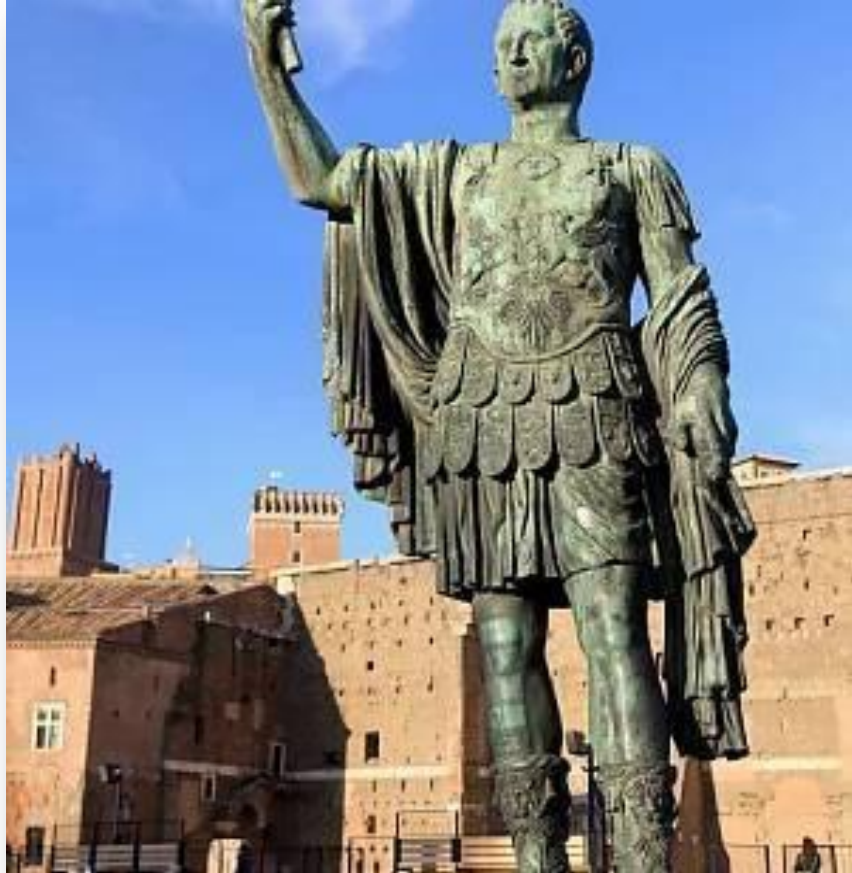
Řím, socha císaře Nervy