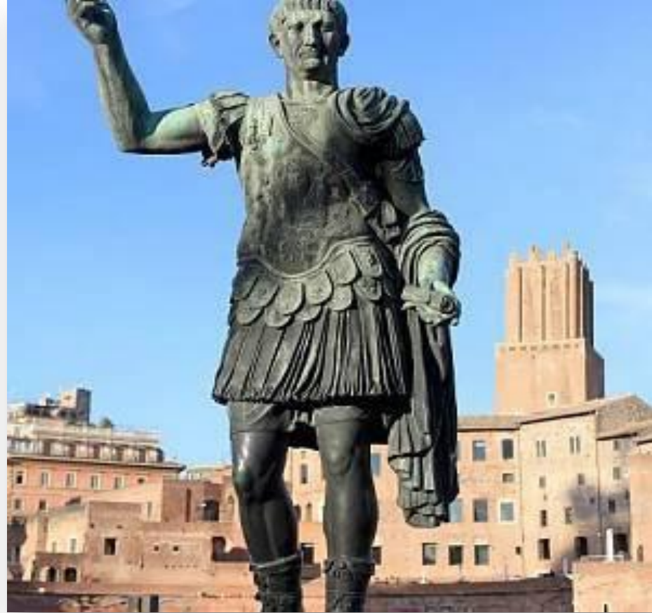
Řím, socha císaře Trajána