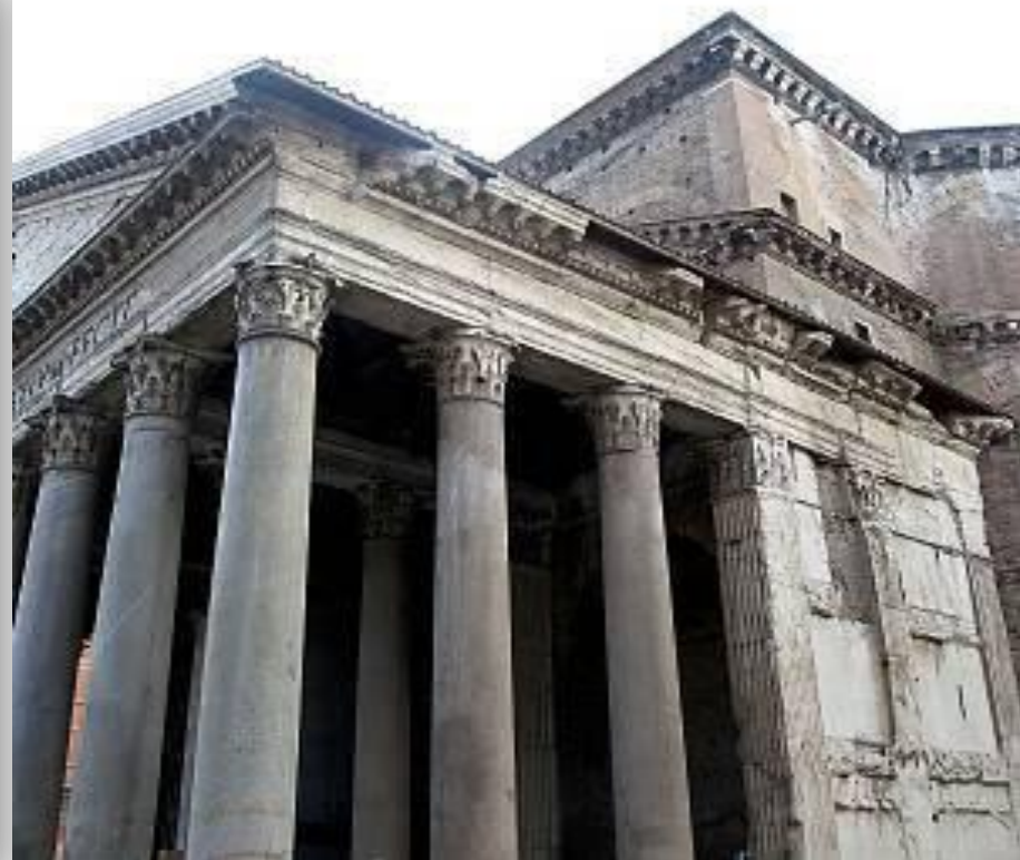
Řím, portikus Panteonu