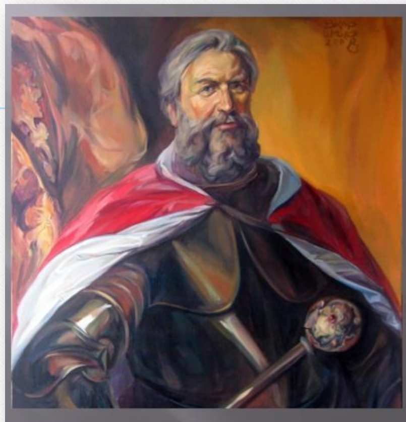
Даниил Романович Галицкий