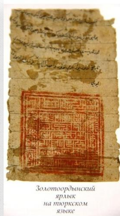
Золотоордынский ярлык на тюркском языке