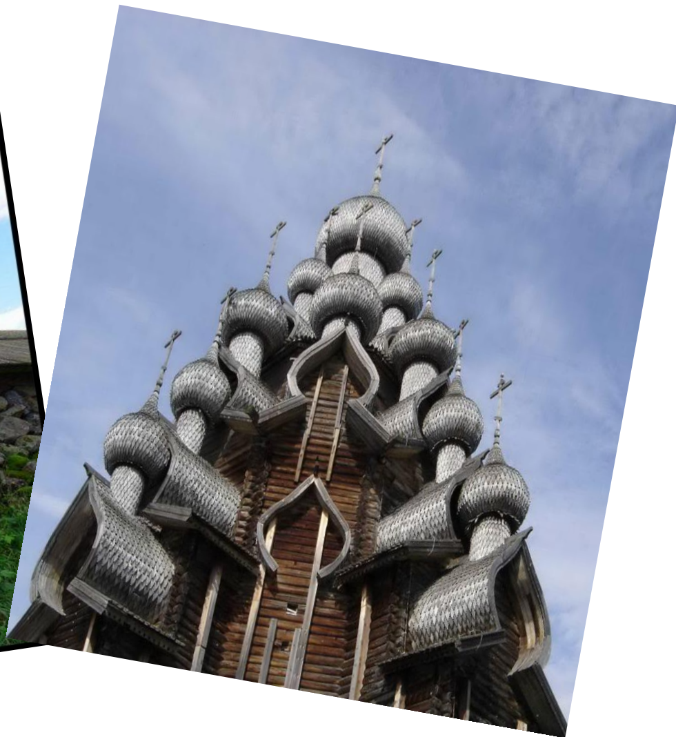
Церковь Преображения Гудauta