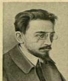
Я. М. СВЕРДЛОВ