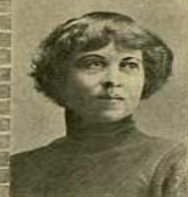
А. М. КОЛЛОТАЙ