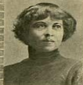
А. М. КОЛЛОТАЙ