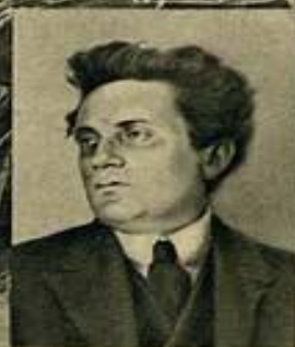
Г. Е. ЗИНОВЬЕВ