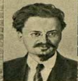
Л. Д. ТРОЦКИЙ