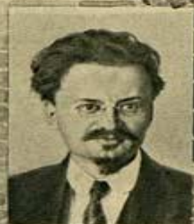
Л. Д. ТРОЦКИЙ