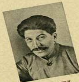
Н. В. СТАЛИН