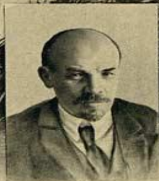
В. И. УЛЬЯНОВ-ЛЕНИН