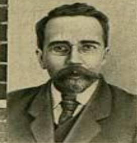
Л. В. КАМЕНЕВ