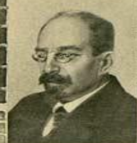
А. В. ЛУНАЧАРСКИЙ