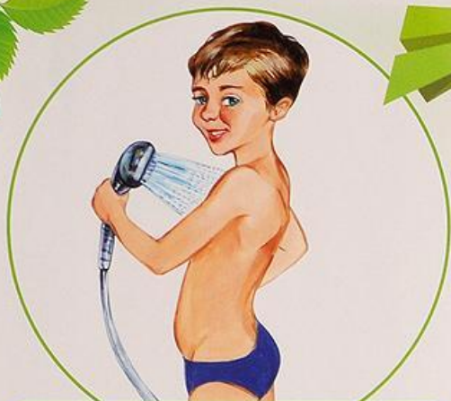
Принимаю контрастный душ

Закаливание дарит нам здоровье и отличное настроение