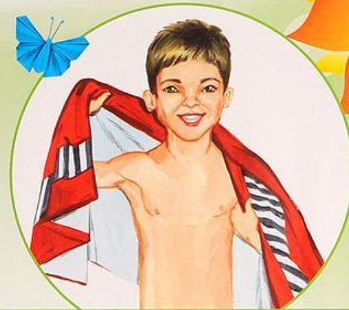
Обтираюсь влажным полотенцем