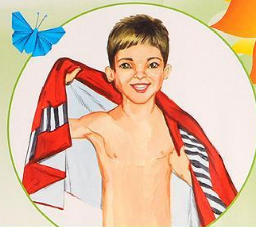
Обтираюсь влажным полотенцем