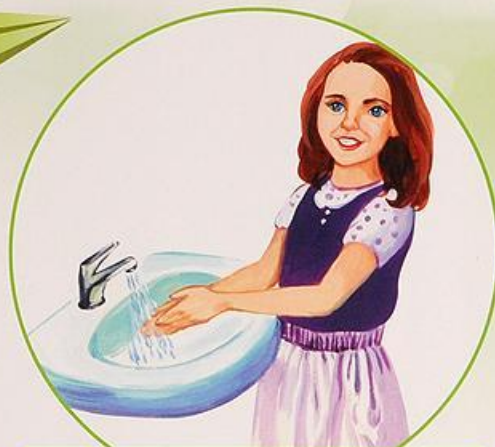
Умываюсь холодной водой