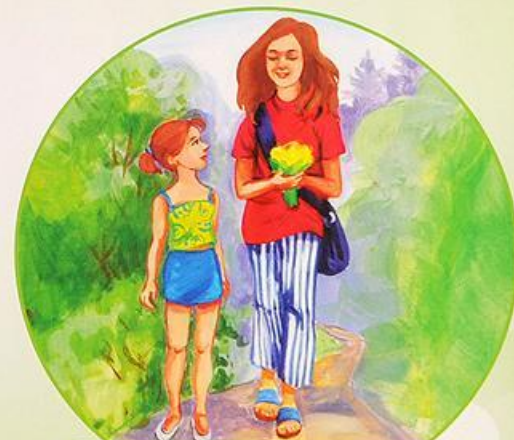
Гуляю на улице