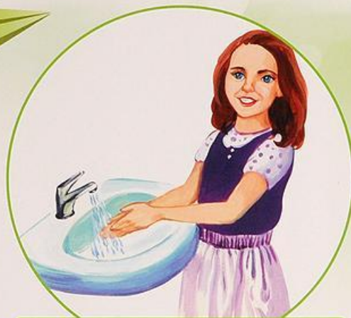
Умываюсь холодной водой