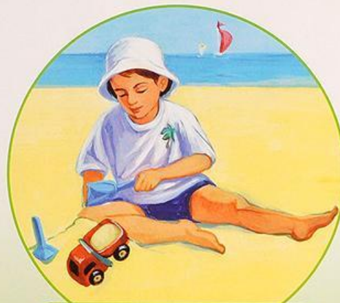
Греюсь на солнышке