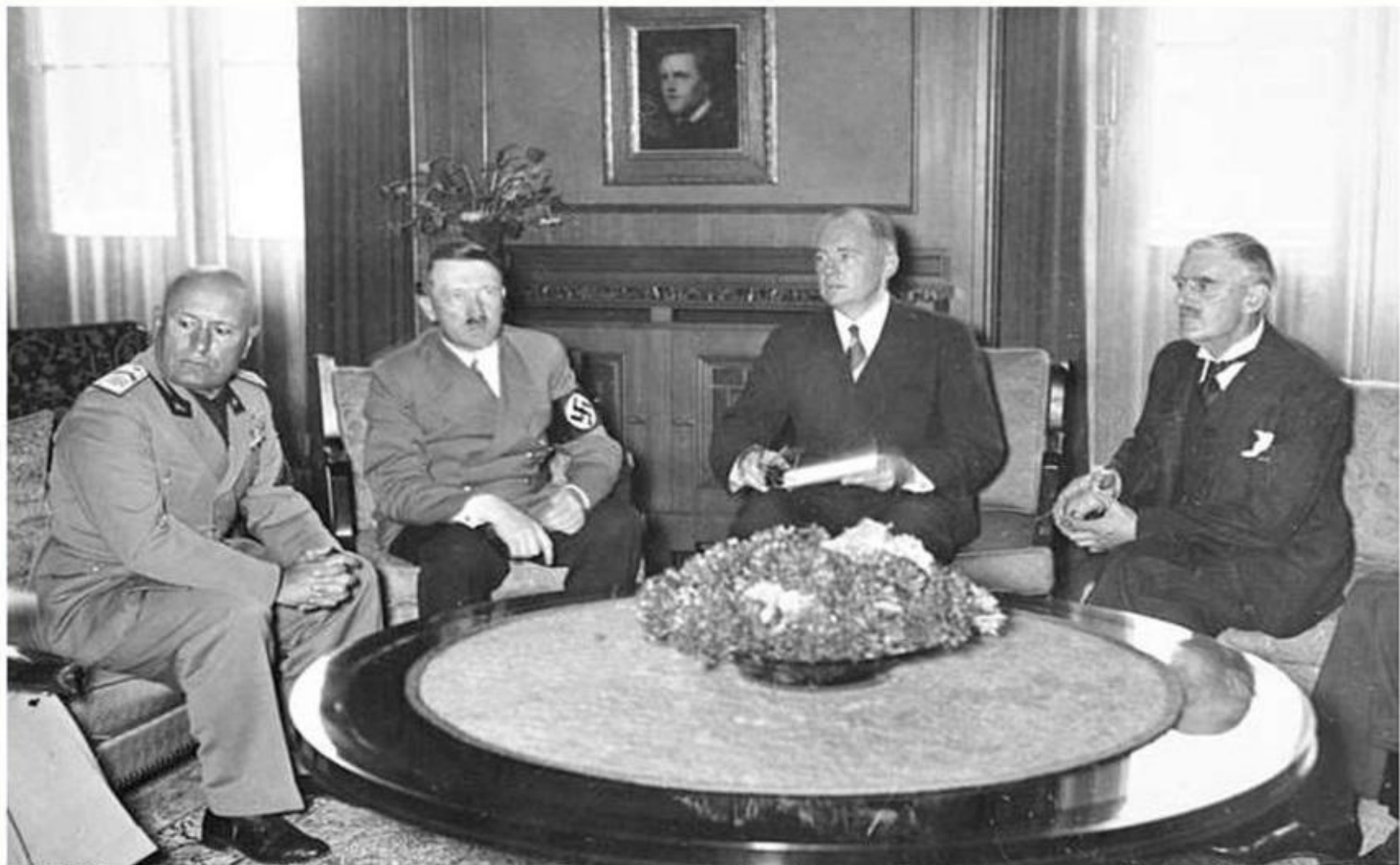
29–30 сентября 1938 года в Мюнхене состоялась конференция глав правительств Великобритании (Н. Чемберлен), Франции (Э. Даладье), Германии (А. Гитлер) и Италии (Б. Муссолини),