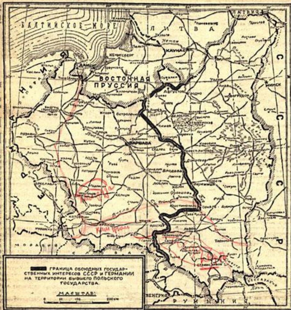
ГРАНИЦА ОБОИХ ГОСУДАРСТВЕННЫХ ИНТЕРЕСОВ СССР И ГЕРМАНИИ НА ТЕРРИТОРИИ БЫВШЕГО ПОЛЬСКОГО ГОСУДАРСТВА.