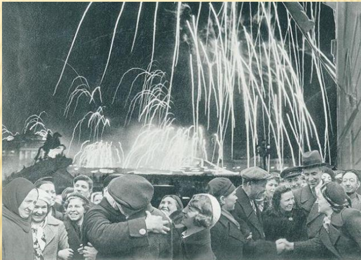
-Великая победа одержана советскими войсками под Ленинградом: