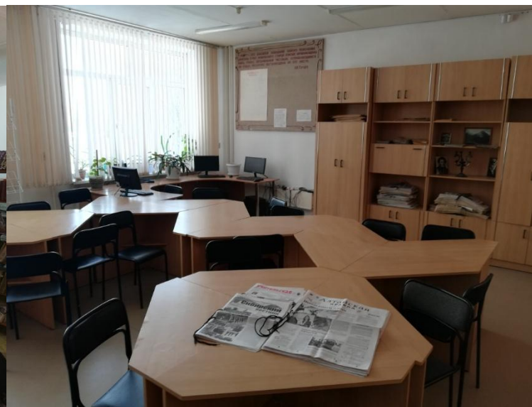
Библиотека и читальный зал