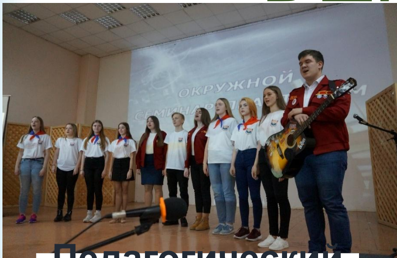
Педагогический отряд «Пересвет»