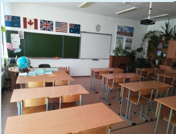
Кабинеты английского языка