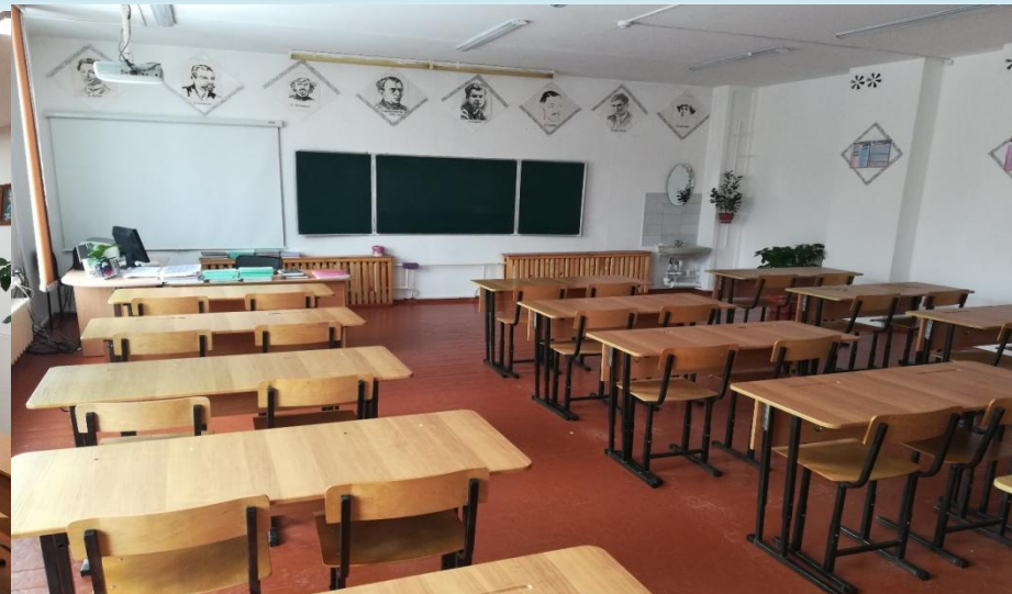
Кабинет русского языка и