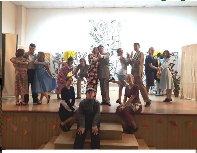
Театральная студия «Маски»