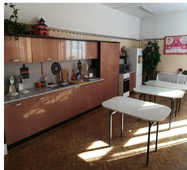
Кабинеты технолог ии