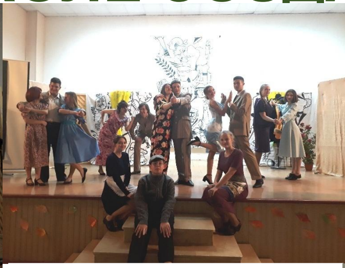
Театральная студия «Маски»