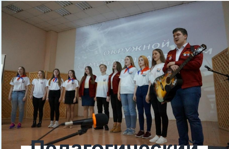
Педагогический отряд «Пересвет»