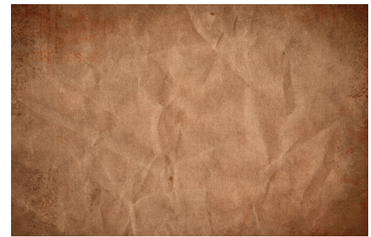
Различные варианты крафтовой бумаги