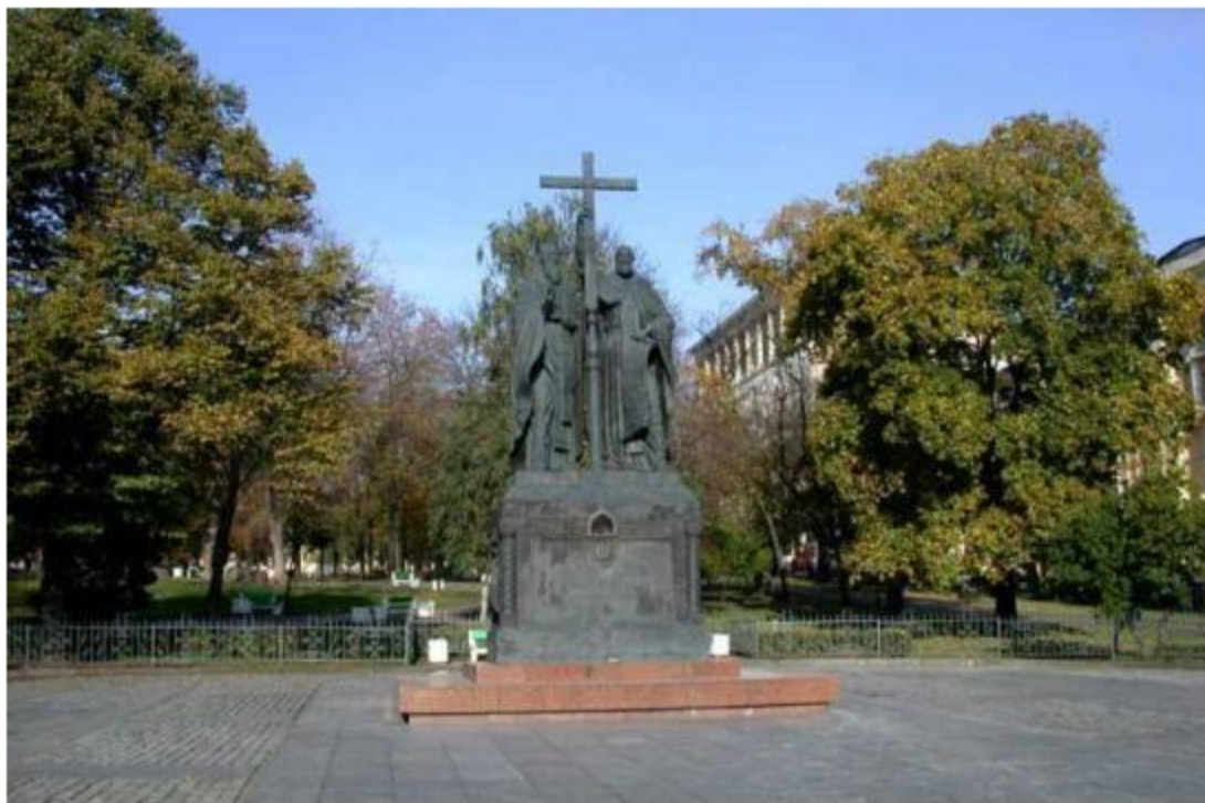
Москва. Славянская площадь