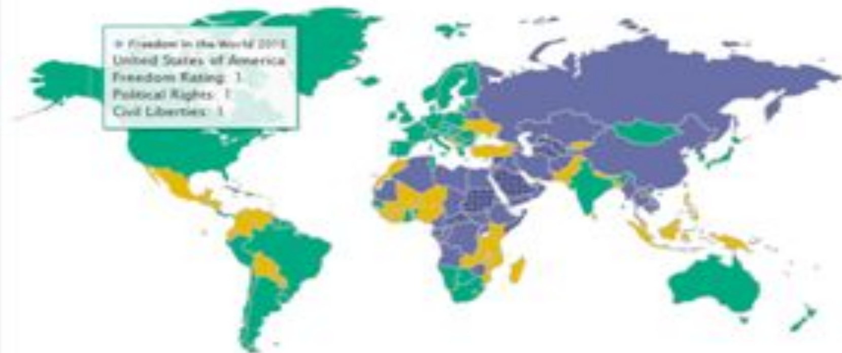
Freedom in the World 2015