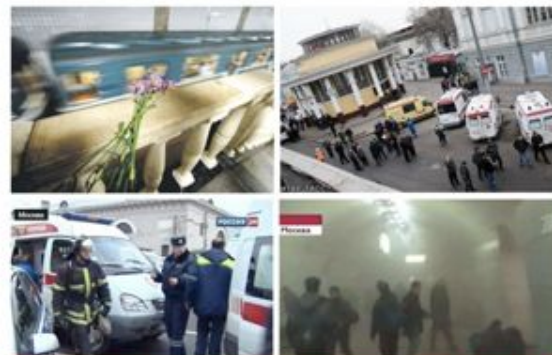
ВЗРЫВЫ НА СТАНЦИЯХ МЕТРО "ЛУБЯНКА" и "ПАРК КУЛЬТУРЫ"

Не спешите сразу уйти домой. Сначала свяжитесь с врачами. Врачи помогут выйти из шока и, если нужно, предоставят необходимое лечение. Помните: после того, как вас спасли, вам необходима медицинская помощь.