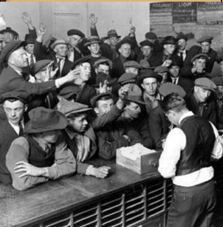
На бирже труда