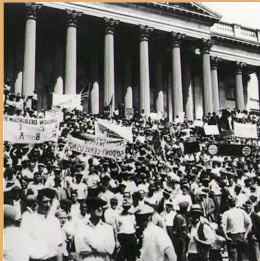
Демонстрация. Вашингтон 1932г.

Признание права рабочих вести переговоры и заключать коллективные соглашения с предпринимателями об условиях найма и труда.