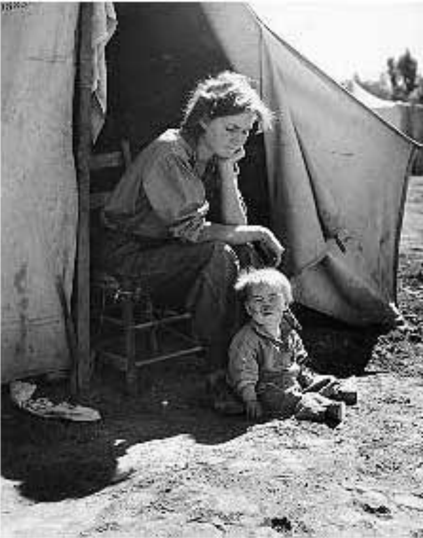
Без дома и без

II Создание Национального совета по трудовым отношениям