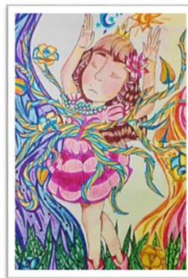
Воўх Надзея, 7 “Ж”