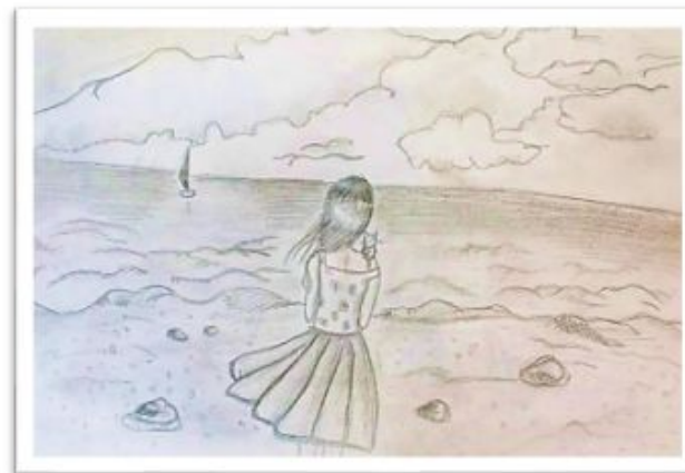
Калмакова Валянціна, 7 “Д”