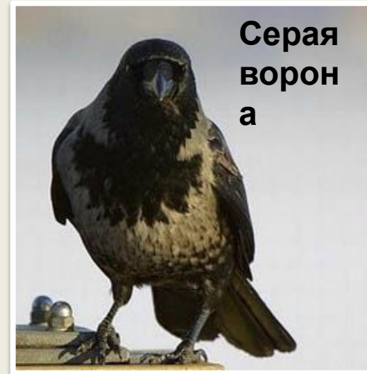
Серая ворон а