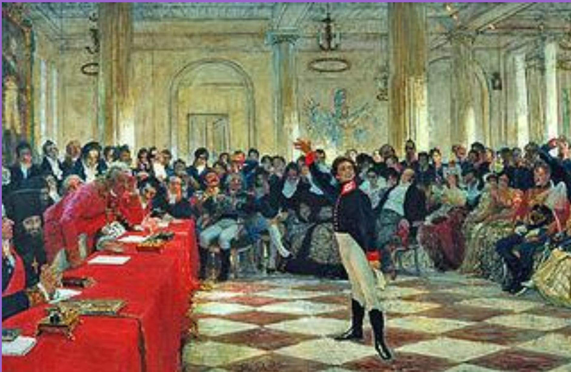
Пушкин на лицейском экзамене в Царском Селе. Картина И. Репина (1911)