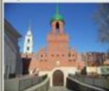
Башня Одоевских ворот