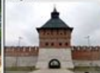
Башня Ивановских ворот