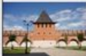
Башня На Погребу