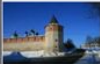
Башня Пятницких ворот