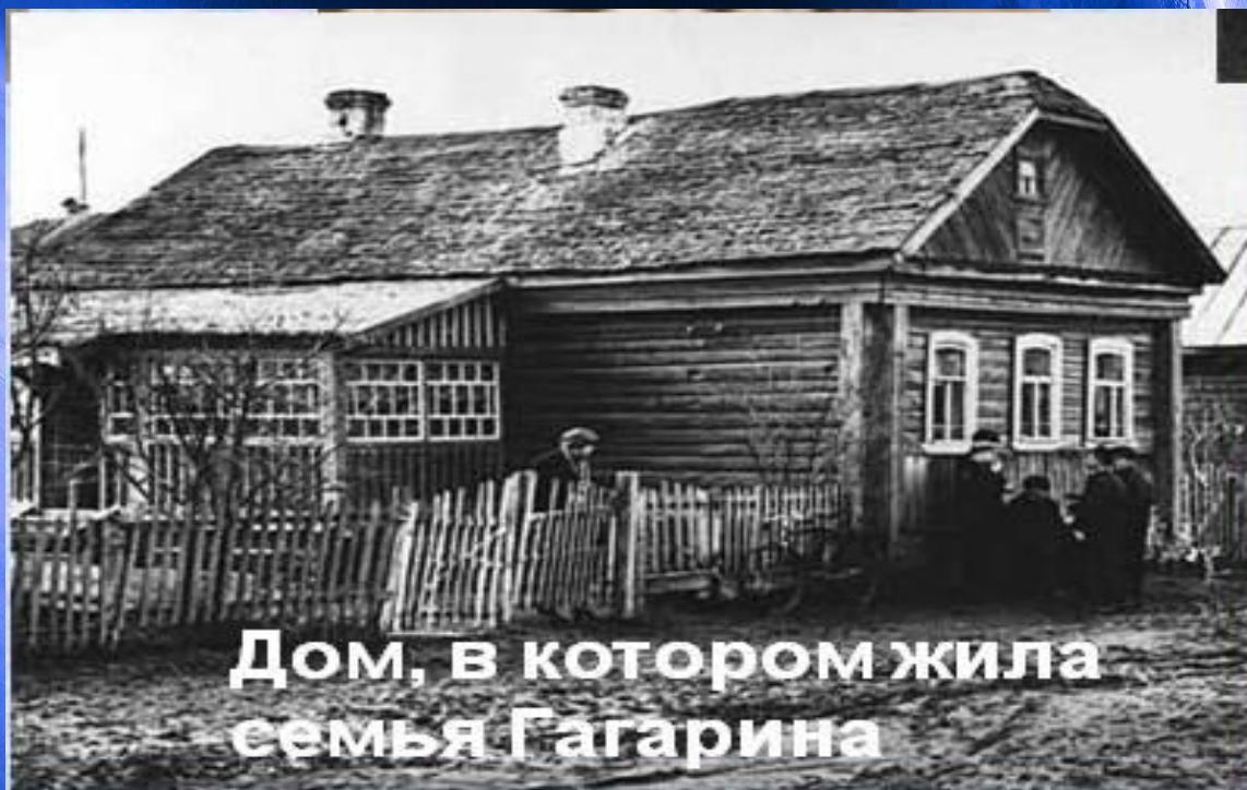
Дом, в котором жила семья Гагарина