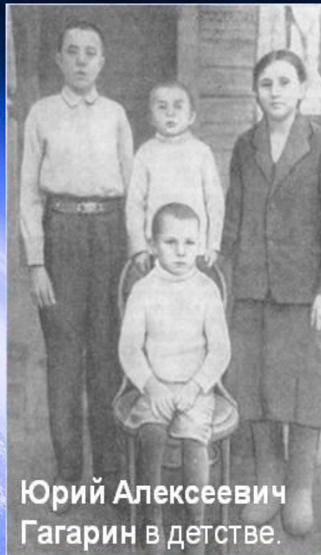
Юрий Алексеевич Гагарин в детстве.