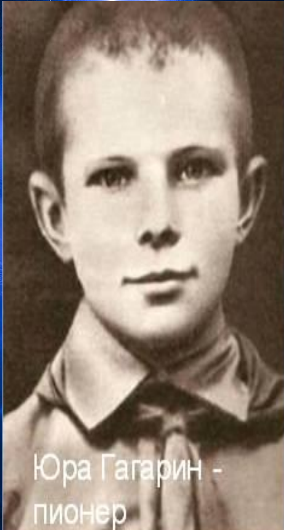
Юра Гагарин - пионер

В школу Юра пошел в сентябре 1941 года, но уже 12 октября в деревню вошли немецкие войска, и обучение прервалось. Около полутора лет деревня Клушино была оккупирована, и только лишь 9 апреля 1943 года, когда Красная Армия освободила эти края, учеба возобновилась.