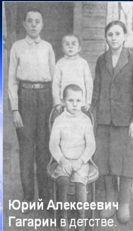
Юрий Алексеевич Гагарин в детстве.