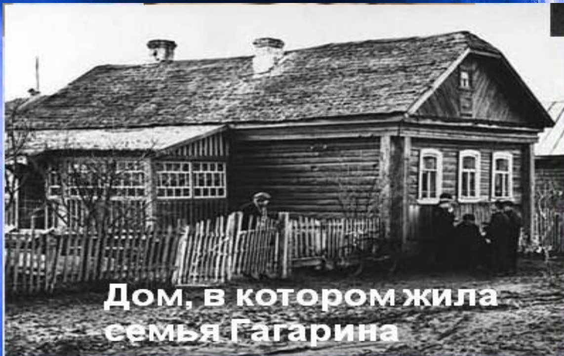
Дом, в котором жила семья Гагарина