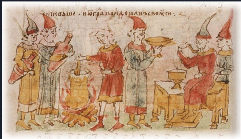
Варка кисели из болтушки

Также он описывает жизнь народа и восстаниях.