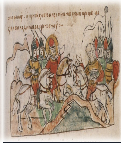
Сражение с половцами