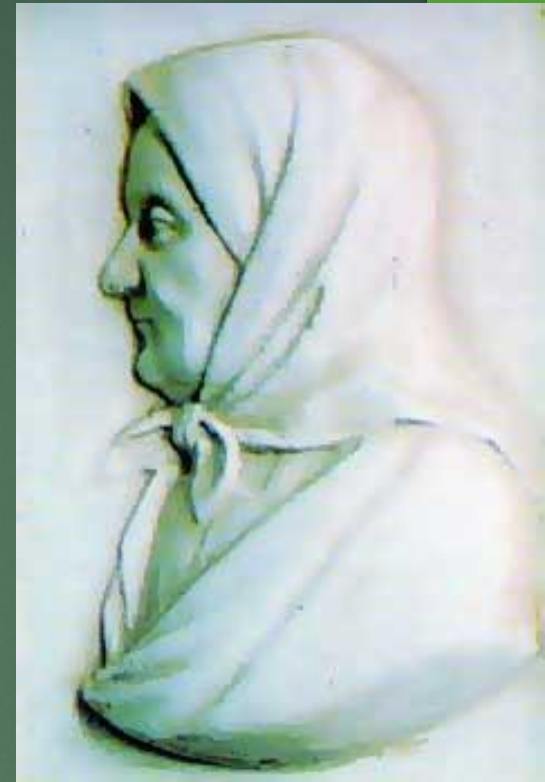
Яковлева Арина Родионовна