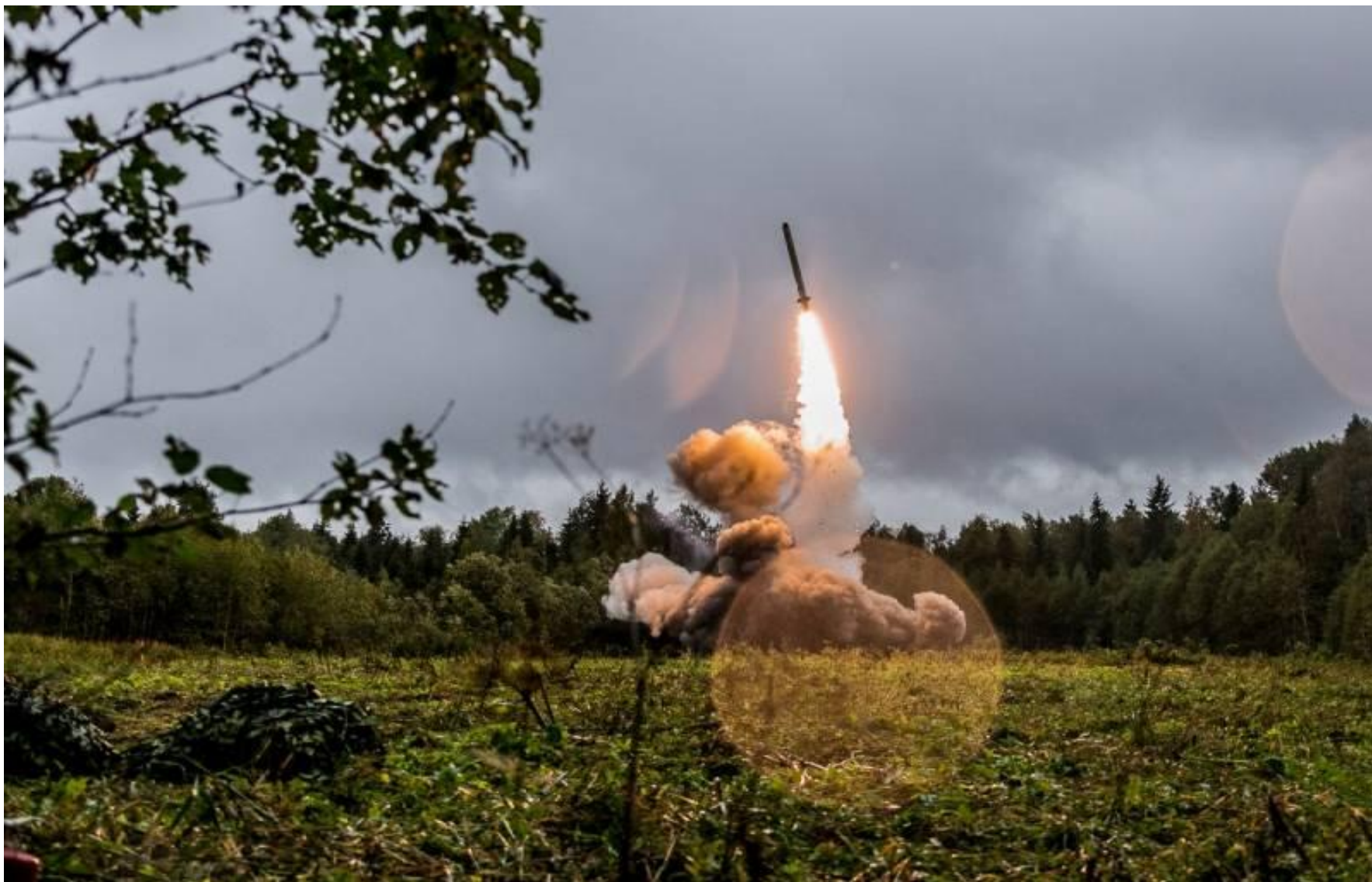
Запуск ракеты комплексом «Искандер»