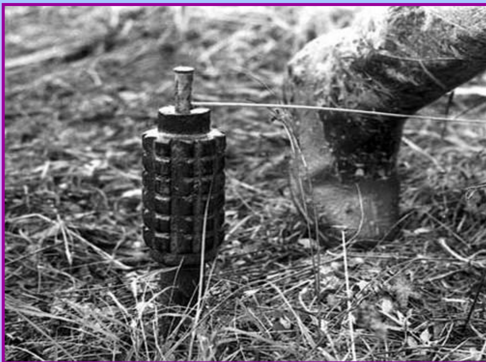
Противопехотная осколочная мина заградительная – ПОМЗ (масса-1,5 кг.)