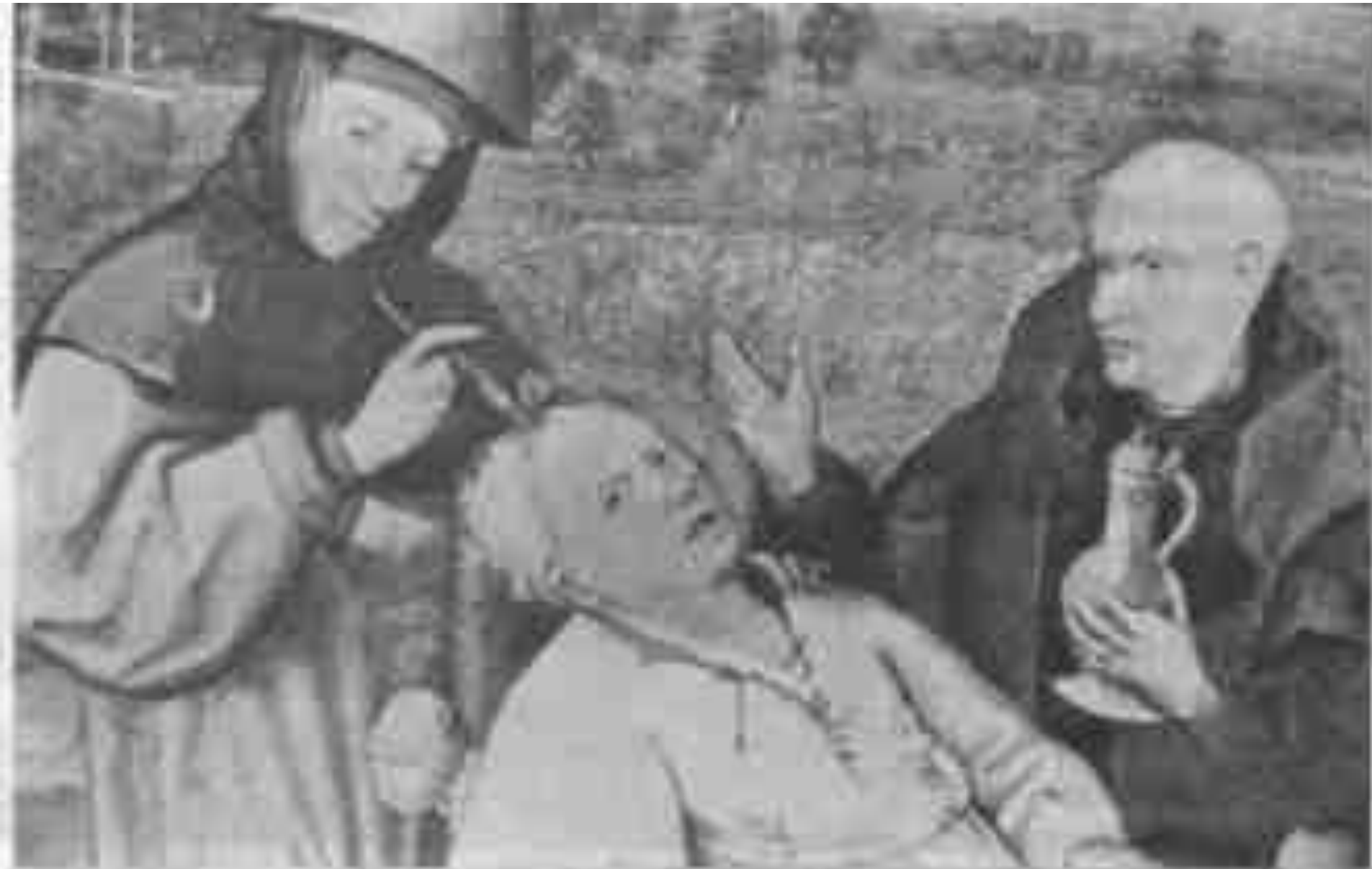
Рис. 61. Иероним Босх (ок. 1460–1516), «Операция у женщины. Удаление части глотки» (фрагмент).