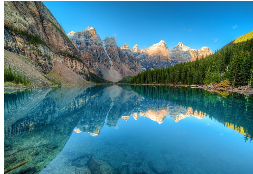
(Ледниковое озеро Морейн)