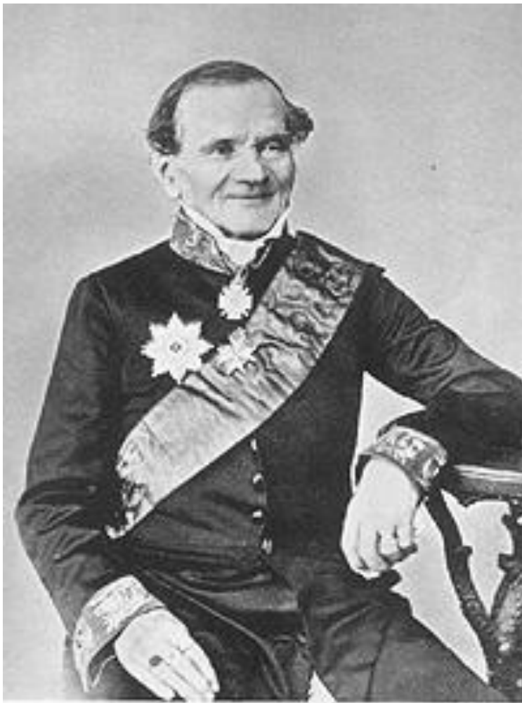
Федор Николаевич Глинка (1786 - 1880)

Федор Николаевич Глинка (08.06.1786 г., село Сутоки Духовщинского уезда Смоленской губернии — 11.02.1880 г., г. Тверь), поэт, публицист . Окончил 1-й кадетский корпус в 1802 г. Участник Отечественной войны 1812 г. , описанной им в «Письмах русского офицера...» (1815-16 гг.). С 1816 г. Глинка — член масонской ложи «Избранного Михаила», «Союза спасения», после его роспуска — «Союза благоденствия». Действительный член Вольного общества любителей российской словесности, в 1819-25 гг. — его председатель, участвует в заседаниях кружка «Зеленая лампа».