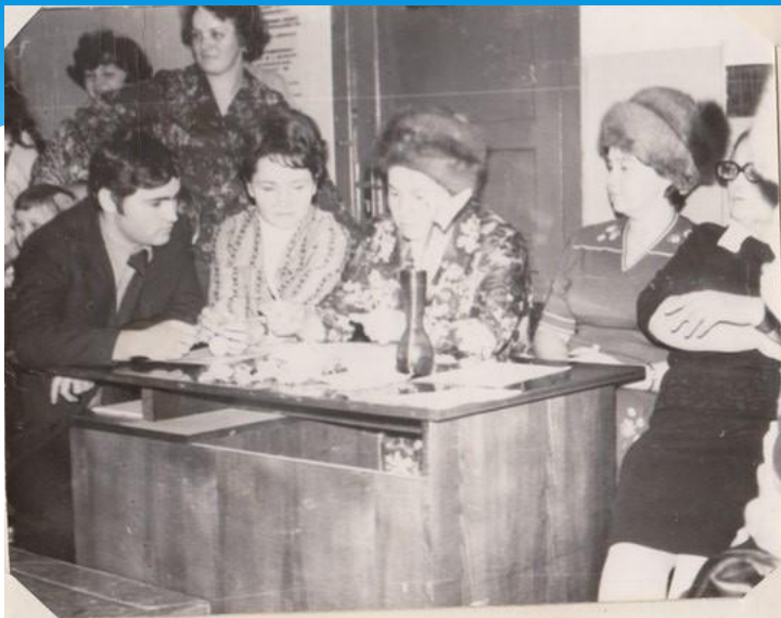
Компетентное жюри уже готово объективно оценить работу участников конкурса