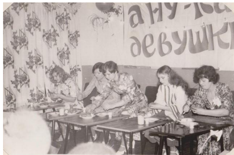
Немало выдумки, ловкости приходится проявить девушкам