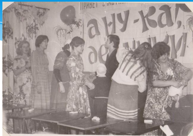
Повязка "чепец" - это совсем не просто, к тому же дано определенное время, значит, надо спешить