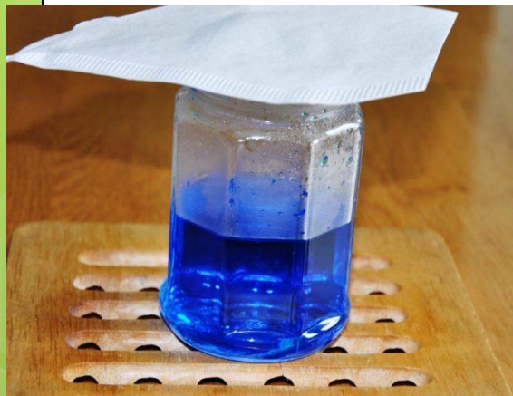
горячий раствор медного купороса