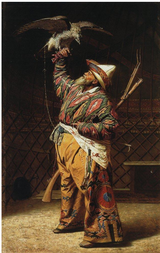
Богатый киргизский охотник с соколом, 1871