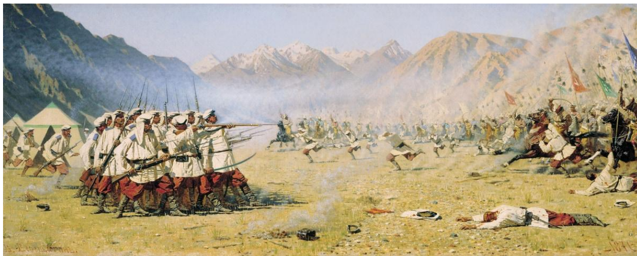
Нападают врасплох, 1871