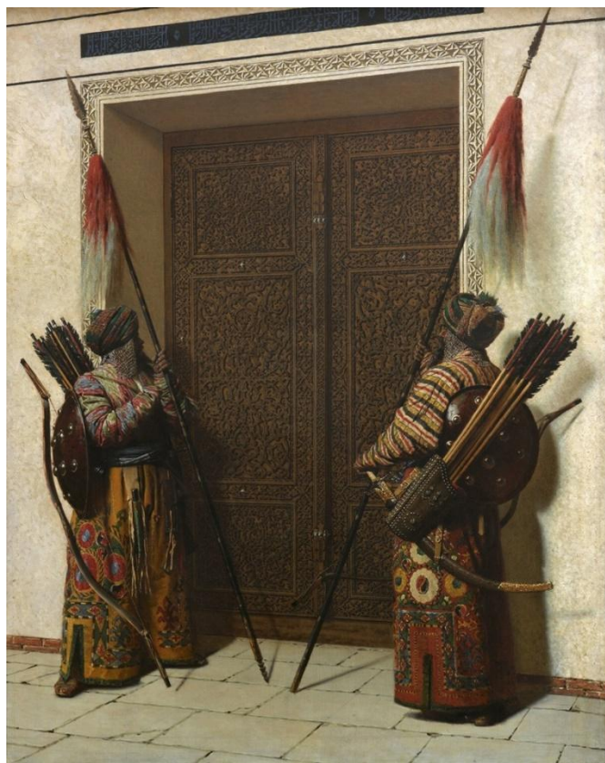
Двери Тимура (Тамерлана), 1872