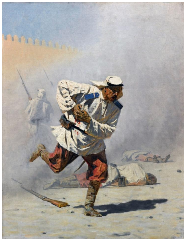
Смертельно раненный, 1873